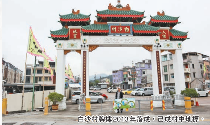
白沙村牌樓2013年落成，已成村中地標。