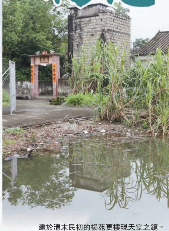
建於清末民初的楊苑更樓現天空之鏡。

新界有700多條村落，但有村志的鳳毛麟角，2015年出版的《蓮麻坑村志》是香港有史以來第一部村志，內容包括自然環境、建置沿革、人口、宗族、政治、軍事、經濟、教育、體育、文物古蹟、民間習俗、人物、海外鄉親、大事記、藝文等。該志去年底列入中國名村志叢書出版。相較下，《白沙村志》的內容沒那麼多，但亦有八個篇章，包括香港沿革簡史、村史概述、政制沿革、七姓村民、地方古蹟、民間組織、生活習俗和文獻記錄。