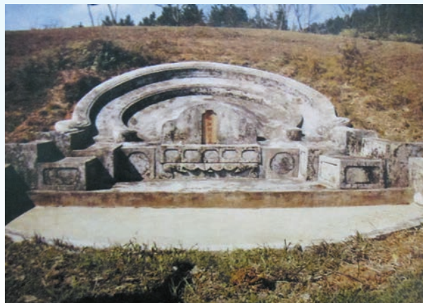
▲由石江胡氏宗祠巡遊往墓地的隊伍，延綿約一公里。