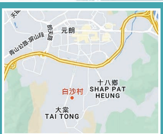
白沙村位置示意圖

從前河堤種下的一些修竹，圍牆亦已消失，礮樓只剩下一個圍斗殘垣。村中楊姓亦有歷史建築，為建於清末民初的楊苑，內有金字頂村屋六間及楊氏家祠，其最具特色之建築，是家祠前兩層樓高的麻石更樓，為十八鄉所僅見。楊苑沒人居住，已見破落痕跡。