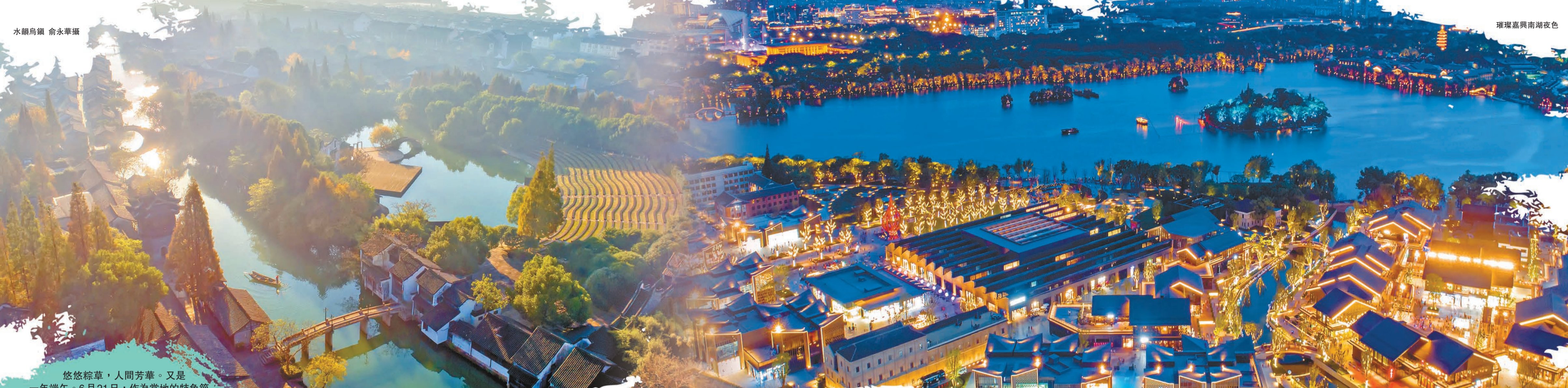
璀璨嘉興南湖夜色