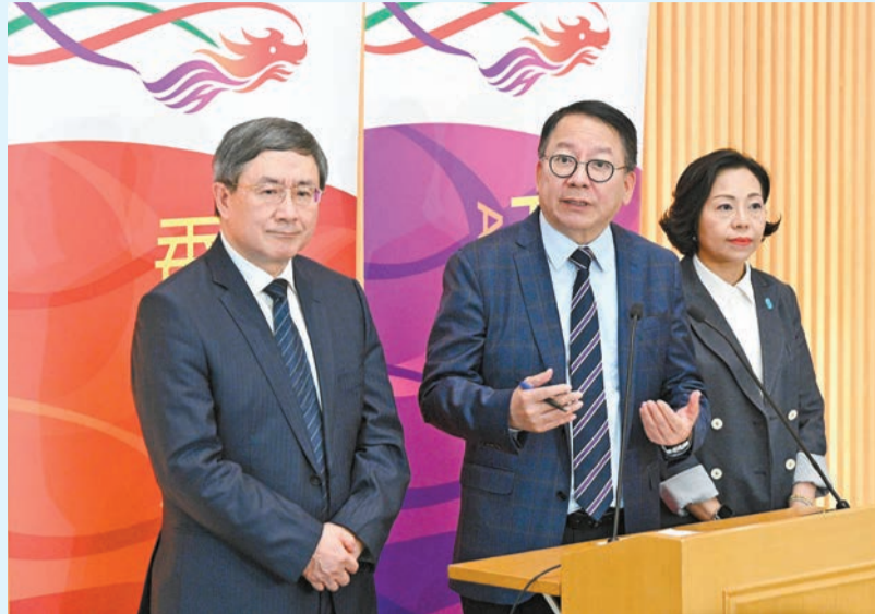
陳國基（中）、卓永興（左）和麥美娟（右）在會議後會見傳媒。

「領導委員會」就上述議題所確立的項目，包括新學年推行「在校課後託管服務試行計劃」，讓有需要的小學學童課後留校接受託管和學習支援，令本來需要在子女課後負責照顧的家長可以外出工作；優化和增設長者健身設施；在大型公園提供雨傘和行山杖借用服務，方便有需要長者；加強辨識和關顧有需要長者和其照顧者，並按需要轉介至社福單位；優化公共街市和熟食市場的衛生潔淨情況，包括改善廁所硬件及衛生、加強巡查執管和加快翻新攤檔；加強防治鼠患，包括研究採用新型偵測和滅鼠技術、強化夜間防治鼠患工作等；提升警方等執法部門的巡查覆蓋面、執法力度和可見性；擴大重鋪行人路路面，安裝投射紅光的新型輔助行人過路裝置等。