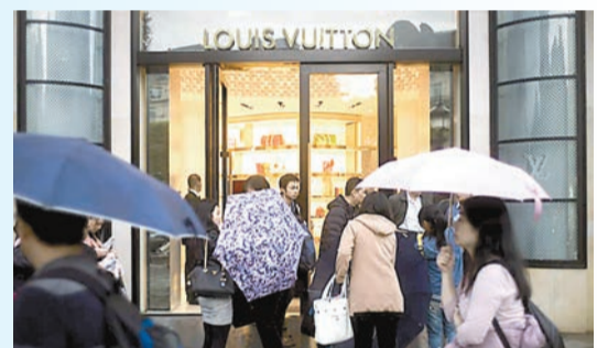
中國遊客在巴黎名店街購物。

伯恩斯坦高級奢侈品分析師也指出，中國消費者比疫情前更加多元化，而 30 歲以下的年輕人和來自下沉市場的消費者將對個人奢侈品消費的增長越發重要。