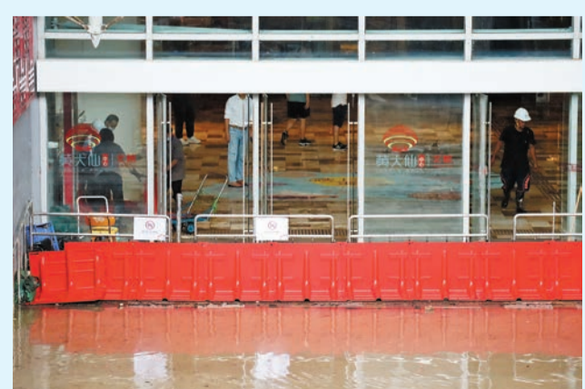
黃大仙中心北館正在搶修，昨日黃雨下一度再遇水浸。

另一方面，港鐵表示，黃大仙港鐵站D1出入口外因路面水位較高，已關閉並裝上擋水板；部分設備因水浸損壞而復修需時，B3出入口仍須關閉。預計排隊出入關及候車時間可能較長，站內升降機及扶手電梯亦繼續暫停使用，有需要乘客可使用樂富或鑽石山站乘搭觀線線。