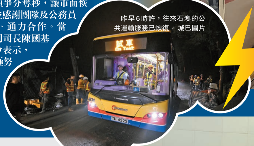
昨早6時許，往來石澳的公共運輸服務已恢復。