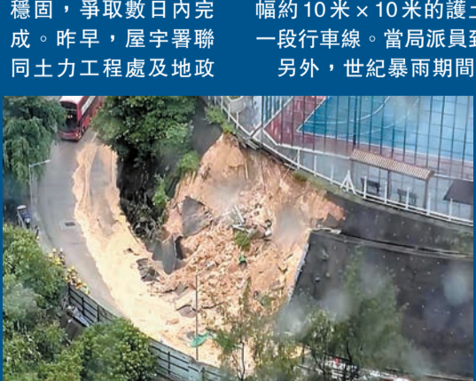
紅磡佛光街足球場附近發生山泥傾瀉，泥土佔據附近一段行車線。