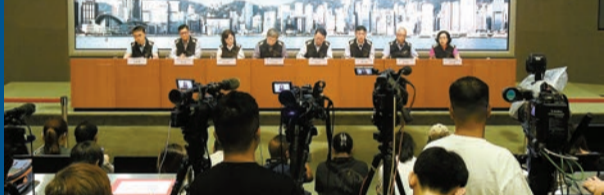
特區政府昨午召開跨部門聯合記者會，簡報市面復修情況。