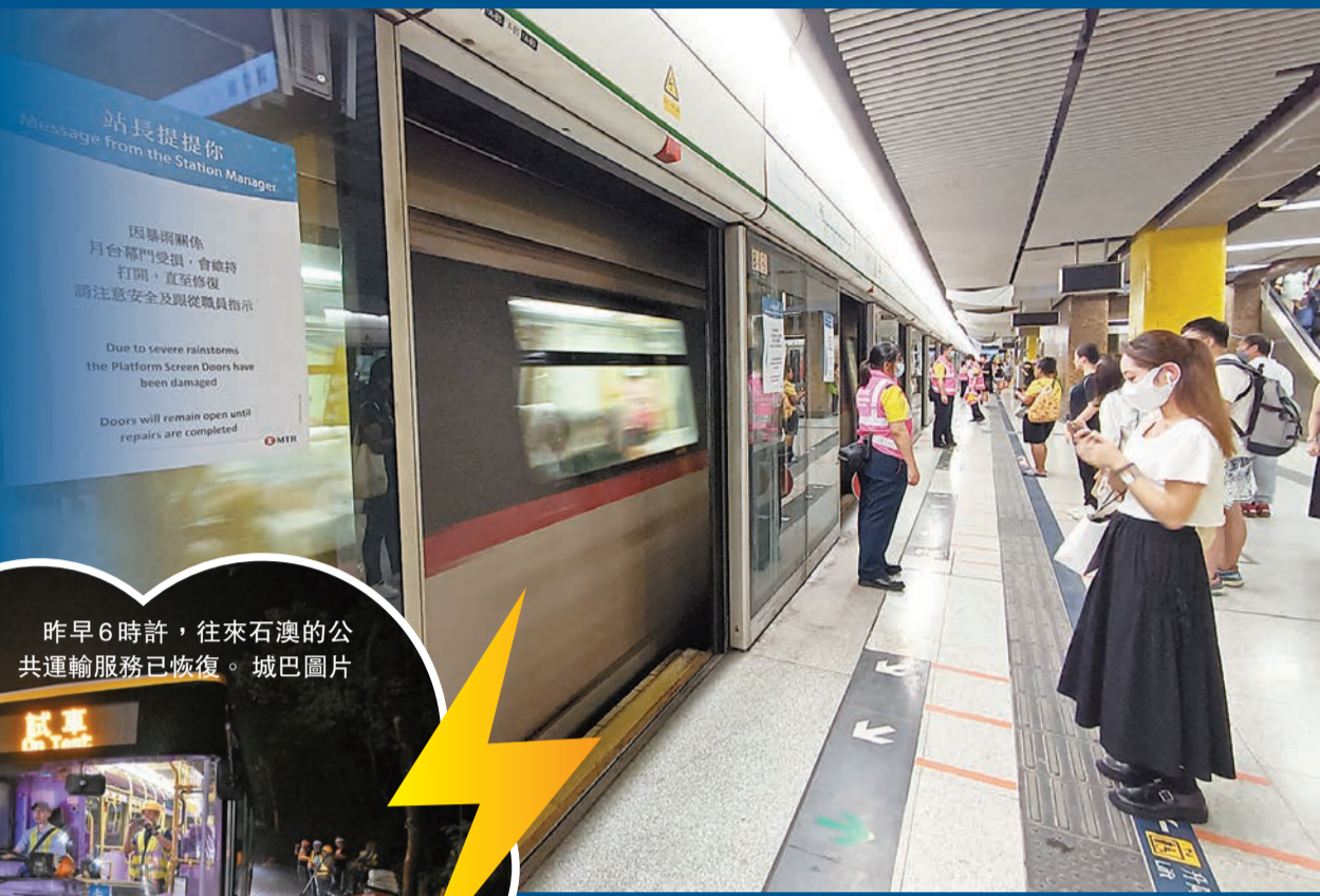
今次被嚴重水浸的黃大仙港鐵站進行搶修工作進展順利。

【香港商報訊】記者林駿強報道：受「海葵」颱風殘餘環流和季風影響，本港日前遭遇世紀暴雨，多區出現嚴重水浸，造成大面積破壞，特區政府連日展開全方位應對和善後工作。昨日，行政長官李家超召開會議，聽取一眾官員匯報市面復修情況、工作安排部署等。他表示各部門必須爭分奪秒，讓市面恢復正常運作，並感謝團隊及公務員同事全力一致、通力合作。當天下午，政務司司長陳國基於跨部門記者會表示，經過各部門積極努力，整體已回復基本運作，並說今日上班、上學大致沒有問題。