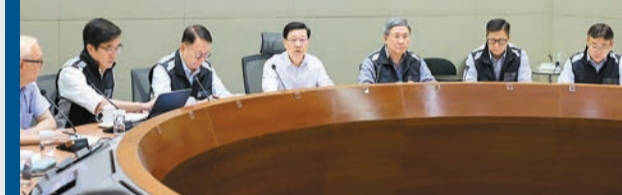
特首李家超昨午召開會議，聽取政府官員匯報各部門工作和市面復修情況，強調要把市民日常生活的不便減至最少。

李家超昨日召開會議，聽取陳國基等官員匯報工作和市面復修情況以及工作日安排部署，提醒各部門要保持最高狀態投入善後工作。其後，他在社交媒體表示，有道路和山泥傾瀉的工程因複雜性和廣泛性須繼續處理，加上持續下雨，部分地區再出現內湧，各部門必須爭分奪秒，讓市面恢復正常運作，把市民日常生活的不便減至最少。李家超感謝團隊和公務員同事，以及各服務單位，全心一致，通力合作，在過去數天不分晝夜工作，迅速修復路面及社區設施，肯定他們的付出。