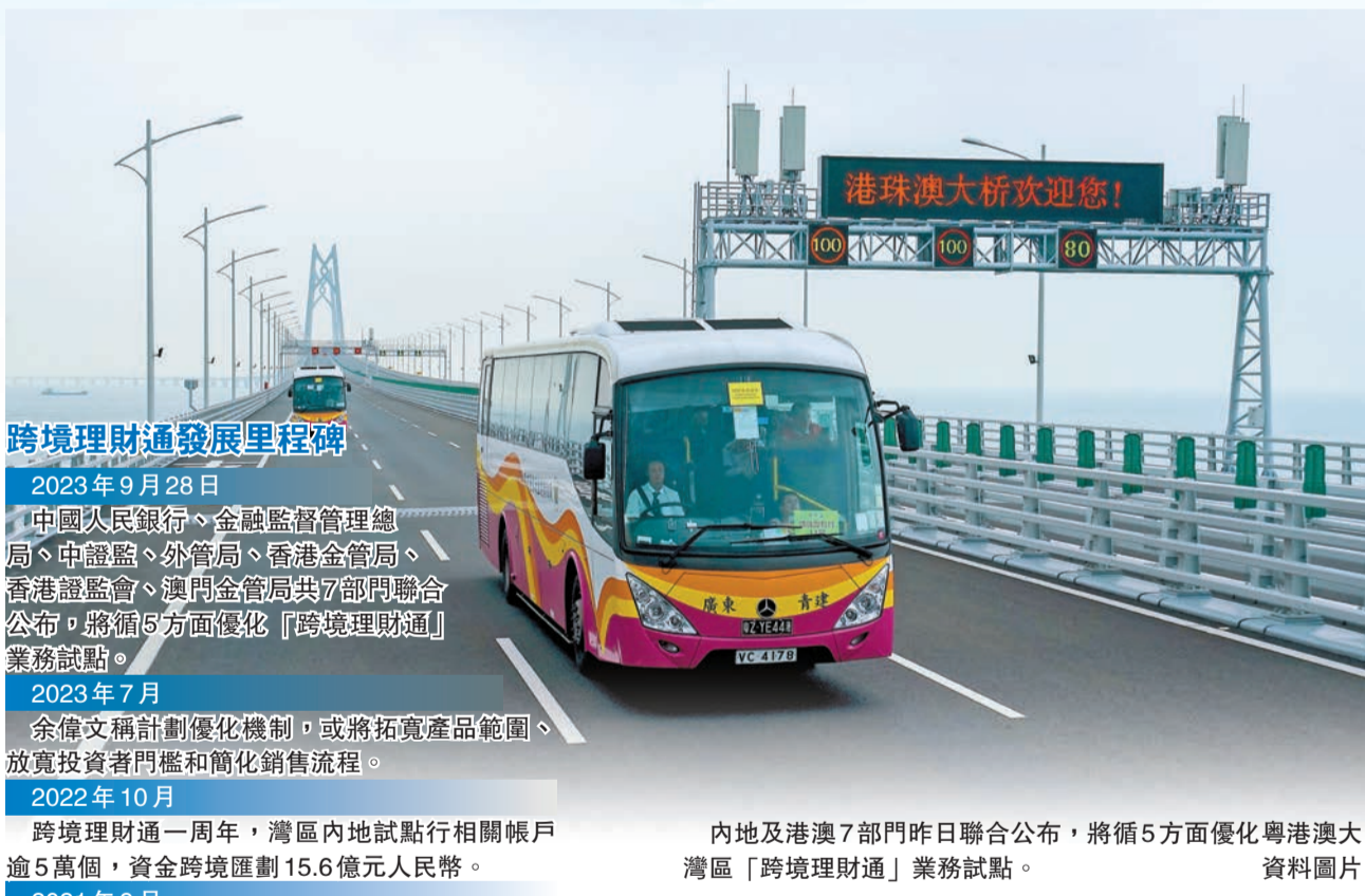
內地及港澳 7 部門昨日聯合公布，將循 5 方面優化粵港澳大灣區「跨境理財通」業務試點。資料圖片

證監會行政總裁梁鳳儀表示，跨境理財通試點計劃的優化措施，可讓合資格的經紀行首次參與試點業務，也給予更多內地投資者更豐富的基金產品選擇，並進一步增強大灣區市場的聯繫。