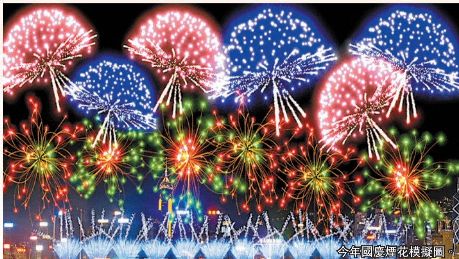
今年國慶煙花模擬圖。