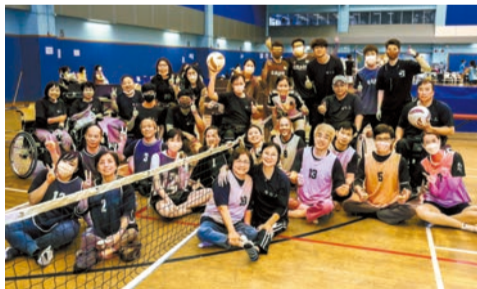
肢體殘障人士參與樂融盃香港輕排球賽。