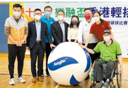
樂融盃香港輕排球賽

創科研發是未來全球的大方向，也可成爲商界營運的「最佳武器」。如有任何查詢，請電郵到 kt@eduhk.hk 與香港教育大學知識轉移辦公室 馮小姐查詢。