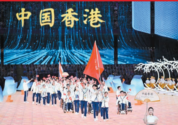
10月22日晚，第四屆亞洲殘疾人運動會開幕式在杭州奧體中心體育場舉行。圖為中國香港代表團入場。