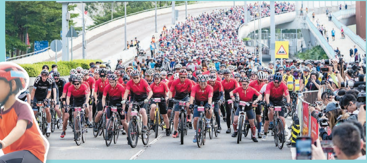
◀今次香港單車節分7個項目，主辦方指有超過5000人參與。圖為小朋友和家長一同參與家庭單車樂活動。