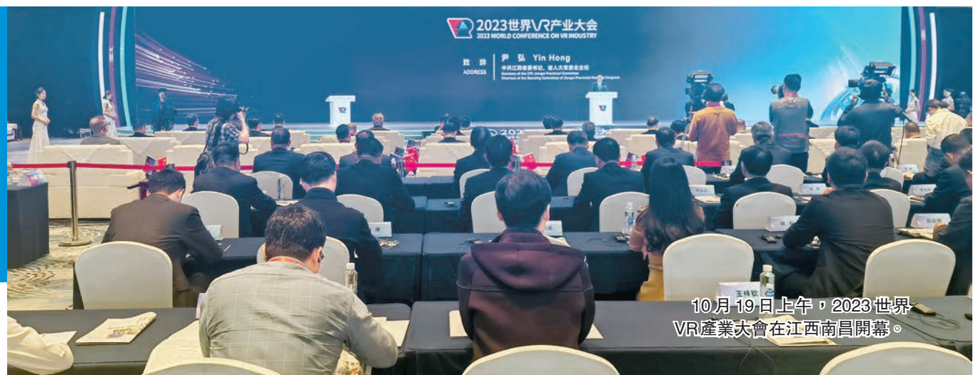
10月19日上午，2023世界VR產業大會在江西南昌開幕。

兩天的時間裏，13場論壇、24場重要活動、近200位重磅演講嘉賓、20多個國家和地區的超3000名專業觀眾參與、國內外200多家VR企業參展、簽約項目數量116個、簽約金額456.15億元……在連續六年舉辦世界VR產業大會的加持下，來自世界各地的VR產業發展新技術、新熱點、新方向、新未來在南昌不斷湧現，江西南昌「VR之城」的金字招牌越擦越亮。黃凌媛