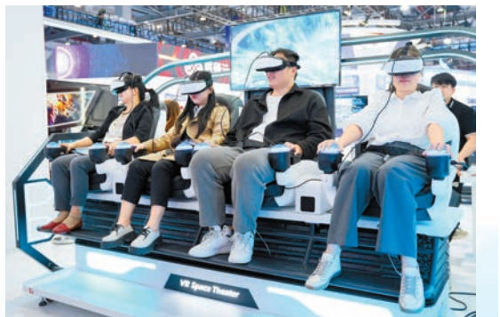
遊客正在進行VR互動體驗。

于英濤表示，VR正在成為助力數字化變革的倍增器，希望再次聚焦教育、醫療、交通、金融服務等領域，探索更多的切合百業的虛擬場景應用，推動數字由二維邁向多維，讓數字更可用，加速數字場景升級和換新。