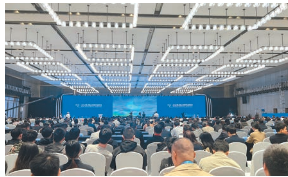
10月20日，2023世界VR產業大會國際交流對接會成功舉辦。

會場內的各類虛實融合的VR技術應用場景令人目不暇接，深受觀眾喜愛。華為展台內的全息AR互動體驗處排起了長隊，遊客走進拍攝區域，一側的顯示屏上便可實時生成各自的虛擬卡通人物，表情動作都十分生動活潑。還有VR職業教育、VR安