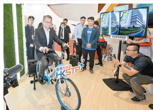
「創新科技嘉年華2023」昨日開幕，陳茂波參觀了香港科技園公司的展覽。

【香港商報訊】記者馮仁樂報導：創新科技署主辦的「創新科技嘉年華2023」開幕，於昨日起至11月5日在香港科學園舉行。據介紹，今次嘉年華以「智慧生活 綠色科技」為主題，展出多項本地創新發明和科研成果，同時亦是「開心香港」的響應活動之一。