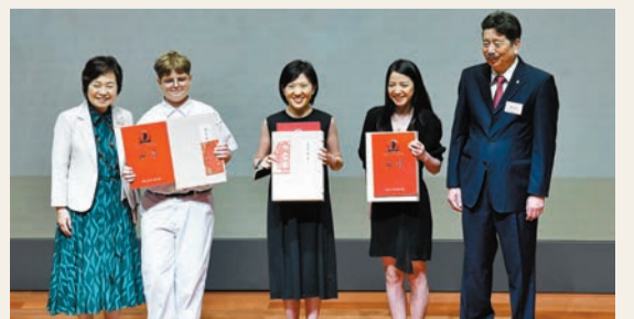
教育局局長蔡若蓮（左）與魯迅文化基金會會長兼秘書長周令飛（右）向非母語組書法（特等獎）的學生頒獎。

蔡若蓮其後與魯迅文化基金會會長兼秘書長周令飛向獲得寫作（特等獎）、書法（特等獎）、非母語組書法（特等獎）的學生頒獎。