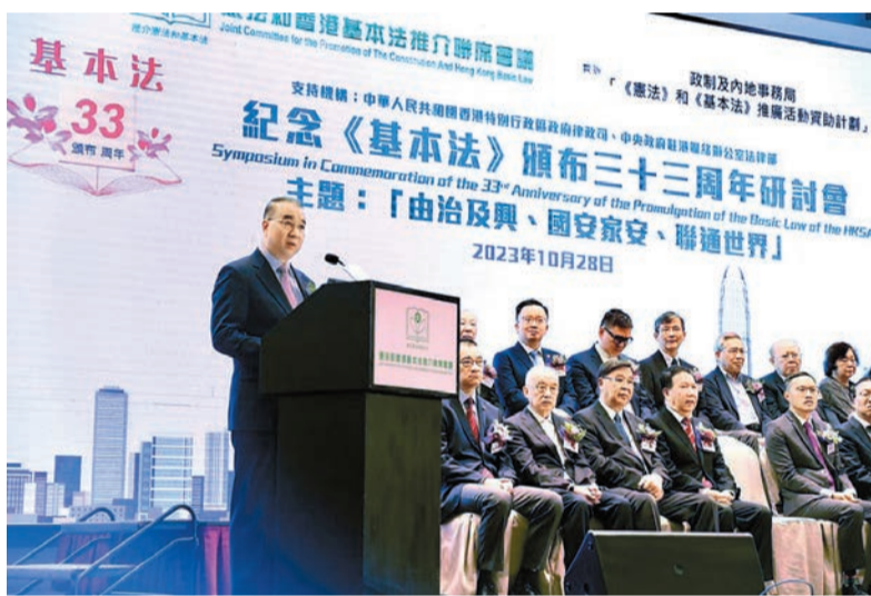
「紀念《基本法》頒布三十三周年研討會」昨日在香港舉行，中聯辦副主任劉光源出席致辭。

行政長官李家超視像致辭表示，在憲法、基本法及香港國安法共同構建的堅實法律基礎下，香港的長治久安、繁榮穩定得到及時、有力的保障。特區政府正全力研究有關立法方案，以盡早完成基本法23條規定的維護國家安全本地立法。他說，2019年，香港經歷「黑暴」、港版「顏色革命」，國家憲法和基本法確定的憲制秩序遭受嚴重衝擊，國家安全和香港繁榮穩定面臨嚴重威脅。中央根據憲法賦予權力，果斷頒布實施香港國安法，之後完善特區選舉制度，落實「愛國者治港」原則。國家安全在香港得到有力維護，社會秩序迅速恢復，香港實現由亂到治。