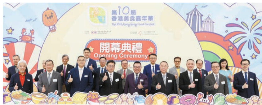
「第10屆香港美食嘉年華」昨日開鑼，設超過300個攤位提供美食佳餚。

【香港商報訊】記者馮仁樂報導：由香港中華廠商聯合會（廠商會）主辦的「第十屆香港美食嘉年華」昨日開幕，一連九天於葵涌運動場舉行。今屆展會設有超過300個戶外攤位，分佈於四大主題區，吸引了大批市民進場掃貨。主辦單位首次將開放時間延長至晚上9時，每晚7時後可免費入場，參展商戶均預期