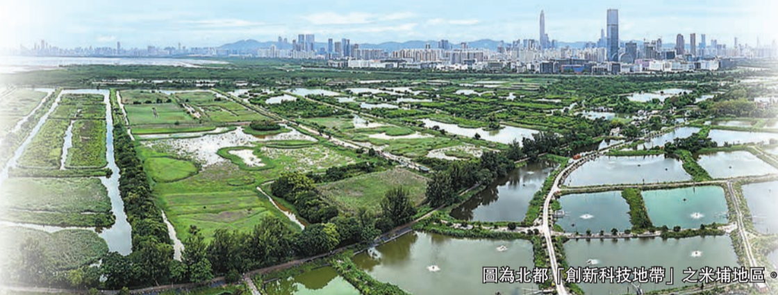
圖為北都「創新科技地帶」之朱埔地區。

【香港商報訊】記者林駿強報道：昨日，特區政府如期發布《北部都會區行動綱領》。發展局局長甯漢豪表示，行動綱領提出多項具體項目和願景，以推動產業發展為主要考慮，分為「高端專業服務和物流樞紐」「創新科技地帶」「口岸商貿及產業區」及「藍綠康樂旅遊生態圈」四大區域。她特別強調了四大區域與深圳對應地區的對接和合作前景，以及以兩個5年去區分北部都會區發展的客觀績效指標。局方表示，希望在2027年或之前為所有主要發展項目啟動收地程序。據悉，北部都會區新發展土地可提供超過50萬個新住宅單位，整體發展後預計可容納250萬人口、提供約50萬個新職位。