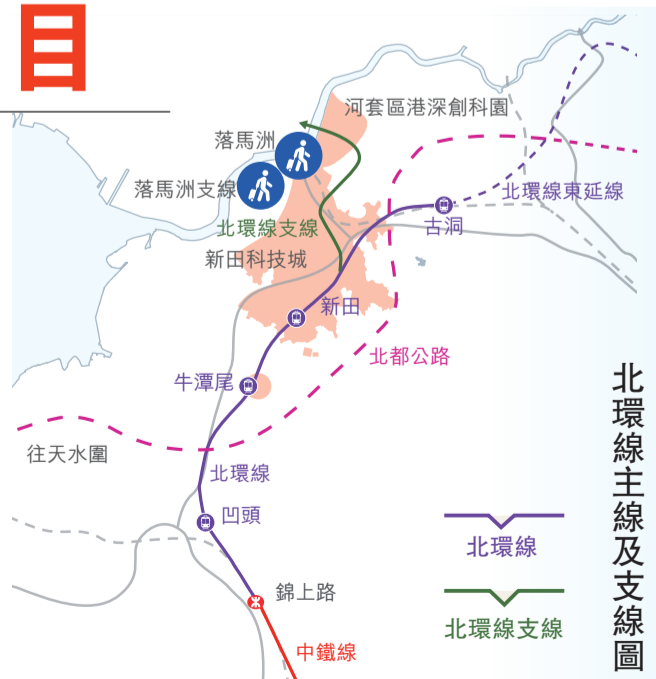
北環線主線及支線圖

北環線支線全長約5.8公里，走線由北環線主線的新田站出發，在洲頭附近及河套區港深創科園設站，並接入深圳的新皇崗口岸，除有助加強跨境聯繫外，亦加強新田科技城創科用地包括河套區的對外交通聯繫。 另有初步建議的中鐵線全長約16公里，將以元朗錦田作為起點，途經荃灣東北部/葵涌東北部，連接現有九龍塘站，接駁東鐵線及觀塘線。擬議中的北都公路全長約18公里，由西面的天水圍開始，東西走向貫通北部都會區。政府亦將推進北部