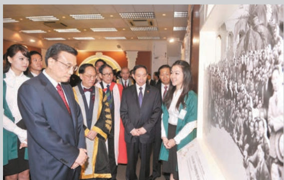
李克強參觀香港大學百年展。