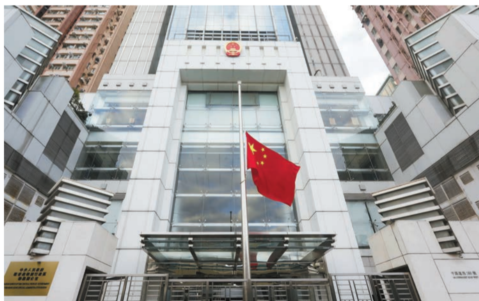
中聯辦下半旗誌哀。