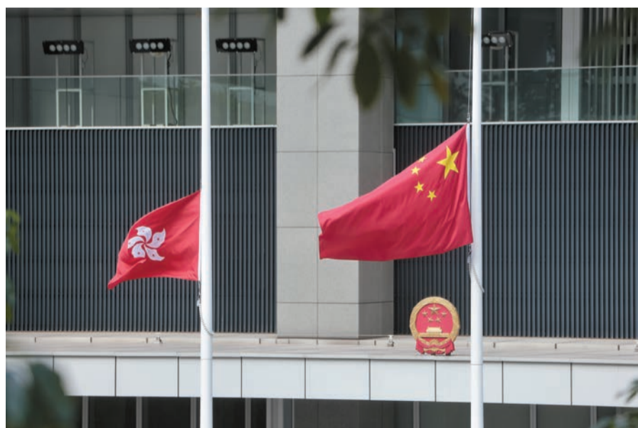
香港特區政府總部下半旗誌哀。