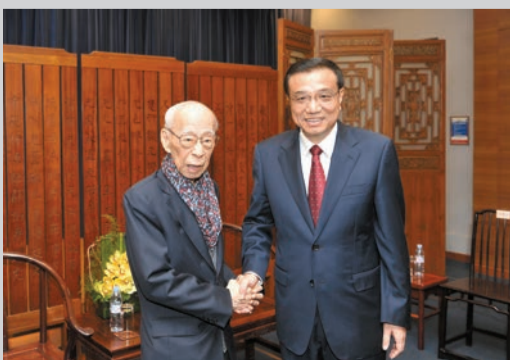
李克強看望國學大師饒宗頤教授。