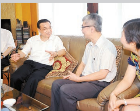
李克強到訪香港家庭。