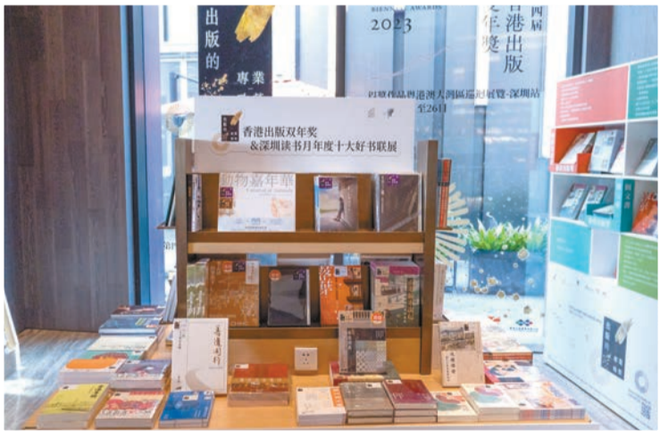
香港出版雙年獎及深圳讀書月年度十大好書聯展展區。

品線路實地考察、開園儀式、崑山臍橙文化旅遊節開幕式、中國（新寧）首屆臍橙產業發展高峰論壇暨《崑山臍橙品質報告》藍皮書發布會等4項活動，既充分吸收往屆經驗，又有所創新突破，對做強新寧文化旅遊產業、做精優勢特色農業、促進新寧高質量發展，都具有十分重要的意義。