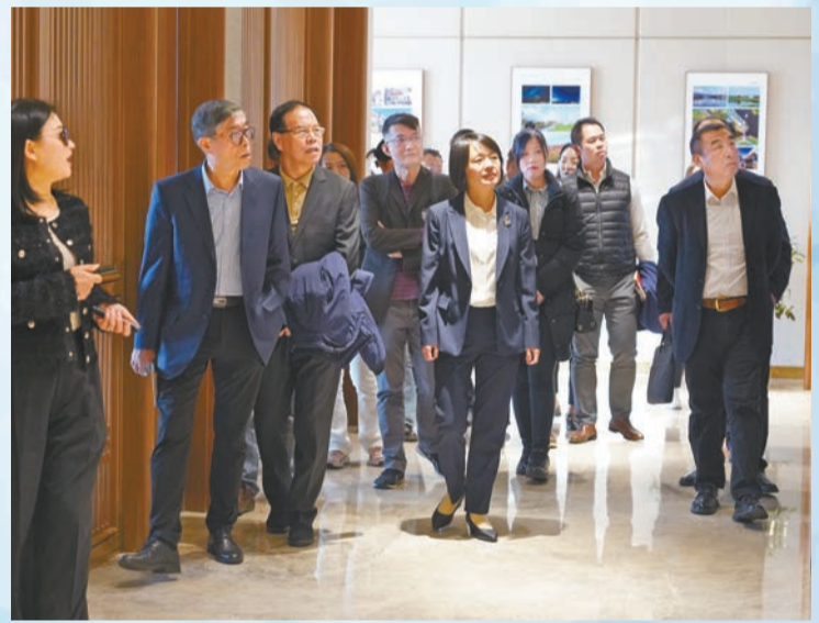
粵港澳大灣區企業家在大同考察。

康養在山西，擁抱大灣區。近日，25位來自粵港澳大灣區的企業家走進山西，考察文旅康養項目，覓商機。期間，企業家們不僅讚嘆山西豐富的文旅資源和發展文旅康養的得天獨厚條件，還紛紛表達了強烈的投資意願。