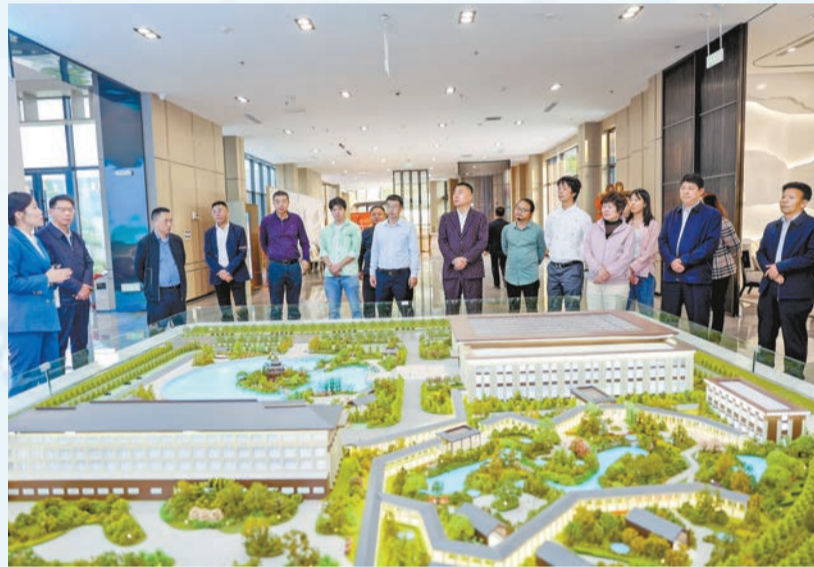
粵港澳大灣區企業家在運城考察。