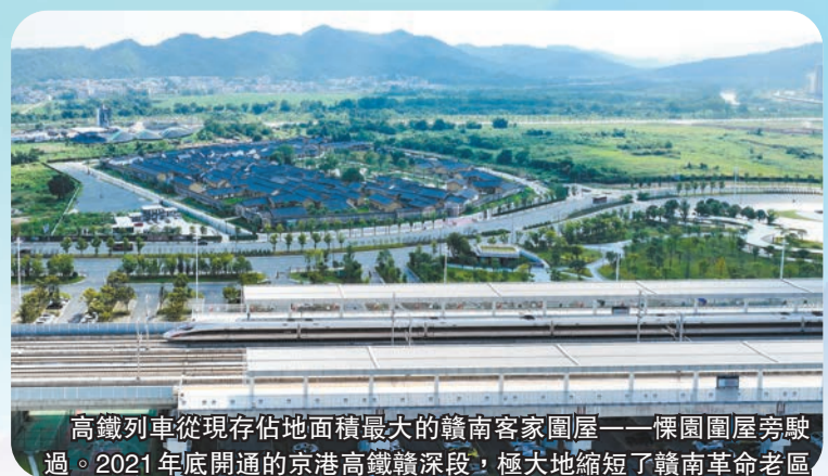
高鐵路車從現存佔地面積最大的贛南客家圍屋——懷國圍屋旁駛過。2021年底開通的京港高鐵路深段，極大地縮短了贛南革命老區同粵港澳大灣區的時空距離，助力「灣區+老區」聯動發展。