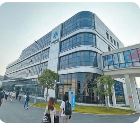
中科宇航位於廣州南沙的大樓。

據悉，中科宇航總部去年6月落戶廣州南沙，填補了大灣區在商業航天領域的空白。落戶以來，公司負責研製的力箭一號運載火箭已連續兩次成功發射，共將32顆衛星順利送入預定軌道，特別是力箭一號遙二運載火箭「一箭廿六星」的成功發射，一度刷新中國一箭多星最高紀錄。此外，中科宇航2021年已開始研發太空旅遊飛行器，按計劃有望在2025年實現太空旅遊項目。