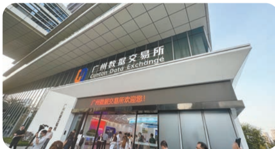
廣州數據交易所大樓。