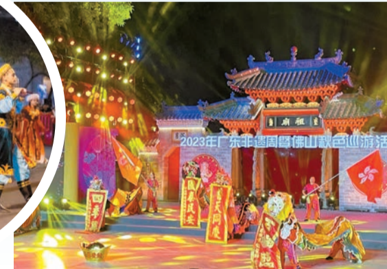
香港獅藝館龍獅體育會帶來的獅獅麒麟表演。

當晚，佛山秋色巡遊時隔三年再次震撼登場。來自佛山和大灣區各城市，以及新疆、福建、貴州、湖南、雲南等地的51個表演節目和11輛彩車爲市民遊客帶來了一場精彩絕倫的民俗文化匯演。