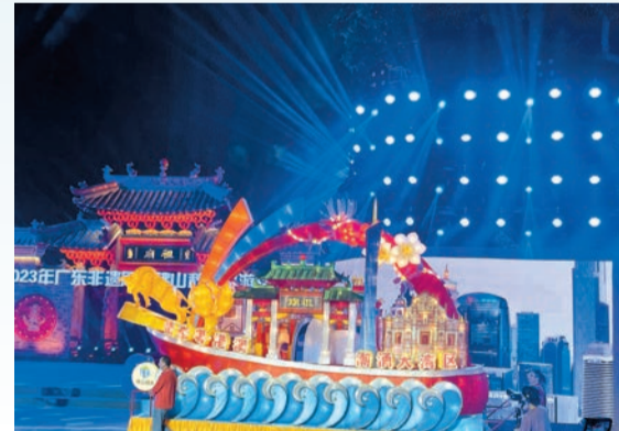
秋色巡遊花車。