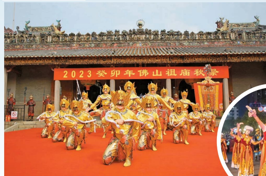
▲祖廟秋祭大典傳統民俗表演。 ▶新疆伽師縣歌舞劇團帶來的新疆舞蹈。

【香港商報訊】記者胡嘯原報導：11月4日上午，佛山祖廟秋祭大典在佛山市禪城區祖廟博物館開幕。佛山祖廟「春秋禱祭」是珠三角最早祭祀真武神的官方祀典，也是大灣區內唯一升格爲禱祭的春秋二祭，是明清以來佛山官民互通互動、增強民眾幸福感的重要民俗活動，已有近六百年歷史。