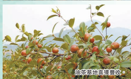
油茶基地喜獲豐收。