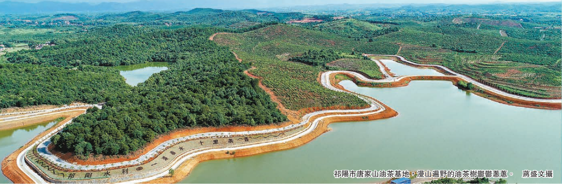
祁陽市唐家人山油茶基地，漫山遍野的油茶樹鬱鬱蔥蔥。

立足新時代新征程，祁陽市將深入貫徹落實習近平總書記關於油茶產業發展的重要講話和指示精神，按照祁陽市油茶產業發展「十四五」規劃及2035年遠景規劃，持續推進油茶新造、低改，支持經營主體做大做強，構建完善「三群四帶」產業建設布局，「三群」即打造以八寶、肖家、三口塘、茅竹、觀音灘、潘市、梅溪、羊角塘等鎮為主的三個油茶產業群，「四帶」即建設泉南高速、356國道、322國道、湘桂鐵路沿線四條油茶產業帶，力爭到2035年，全市油茶林面積達到100萬畝，其中高產油茶林50萬畝，油茶綜合產值突破100億元，着力將油茶產業打造成為促進群眾增收的民生工程、生態宜居的綠色工程、鄉村振興的特色工程，為全省探索更多可借鑒、可複製、可推廣的祁陽經驗。