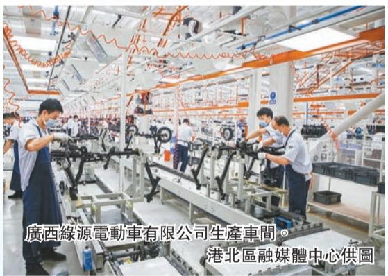
廣西綠源電動車有限公司生產車間。

2015年以來，貴港市積極規劃建設中國—東盟新能源電動車生產基地，基地規劃面積約1萬畝，總投資約157億元。目前基地累計引進愛瑪、綠源、台鈴、立馬、五星鑽豹、歐派等國內知名整車企業以及豪派、飛能等配套企業共100多家，建成投資50多家，形成年產500萬台兩輪電動車、50萬台三輪電動車以及500萬台（套）電動車零部件