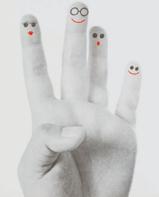
香港家庭計劃指導會海報。