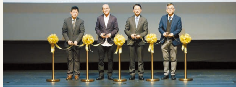
(左起)香港文化博物館署理總館長鄧民亮、設計師及藝術家韓秉華教授、康樂及文化事務署署長劉明光和博物館諮詢委員會藝術專責委員會主席許焯權教授主持「迁想無界——韓秉華藝術與設計展」的開幕儀式。