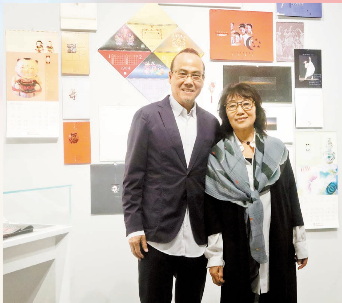
韓秉華和設計師及藝術家蘇敬儀合作無間，創作一系列月曆作品。

香港文化博物館即日起舉辦「迁想無界——韓秉華藝術與設計展」，展出著名本地設計師及藝術家韓秉華超過300組作品，包括公共空間的雕塑模型、海報、設計手稿和水墨畫等，向觀眾展示他的設計才華以及他在社會公益方面的貢獻，呈現其豐富多元的風格和無界創意。