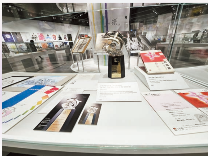
香港回歸吉祥物「中華白海豚」紀念座。