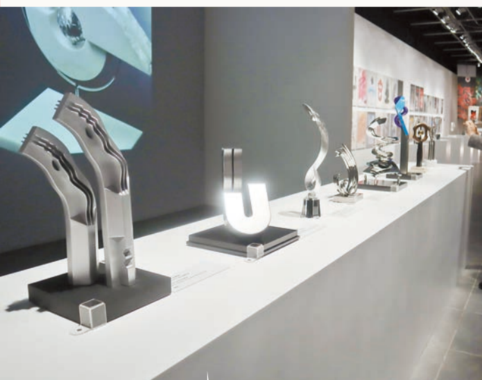
九龍公園的《魚進龍》雕塑(左一)和香港中文大學聯合書院的《光輝聯合人》雕塑(左二)。