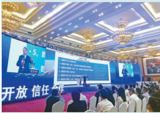
世界數字經濟論壇現場。

【香港商報訊】記者蔡易成報道：11月25日，第五屆世界科技與發展論壇平行論壇——世界數字經濟論壇在深舉行。論壇以「數字經濟：世界經濟可持續發展的驅動力」為主題，圍繞世界經濟與數字經濟、數字經濟前沿科技、厚培數字經濟「人才底座」、數字經濟基礎設施、數字經濟合作與治理、發展數字經濟的全球合作六大議題展開，聚焦國際社會共同關注的重大發展問題，探討數字科技賦能全球可持續發展，推動全球數字經濟合作。