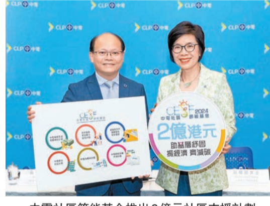
中電社區節能基金推出2億元社區支援計劃。

用，預計明年第二季寄出消費券。對於工商客戶，其中一支援措施是撥款3000萬元資助中小企安裝或更換更具高能源效益的照明和空調設備，減低客戶的營運成本。中電表示，各項支援措施，合計超過二億元。 派現金券支援及推廣低碳生活 港燈公布，明年將撥款超過5500萬元推出「現金券計劃」，對象為參與港燈電費優惠計劃及有經濟困難的客戶，預料將有一萬個家庭受惠。每戶將獲發200元現金券，以購買日常用品。港燈亦繼續為合資格非住宅客戶提供免費能源審核，並提供每個場所最多30萬元資助採用節能低碳電力設備。每個過渡性房屋項目及協助弱勢社群的社區設施，將可獲最多100萬元資助。