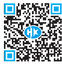
掃碼睇 代表團行程安排

迎晚宴上再次表示，中國載人航天工程在30年間取得非凡成就，歷史性地實現了中華民族的千年飛天夢想，中華兒女無不深感自豪。代表團這次訪港，可以讓香港市民近距離分享國家航天事業發展的驕傲，並加深市民大眾對國家航天科技發展的認識，充分展現了中央人民政府對香港特別行政區的厚愛和支持。