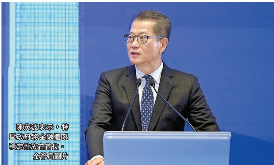
陳茂波表示，特區政府將金融體系穩定性放在首位。

【香港商報訊】記者姚一鶴報導：香港金管局與國際結算銀行（BIS）合辦的高級別會議，昨日在香港圓滿閉幕。一眾演講嘉賓討論及分享了中央銀行及政策制定者面對的主要挑戰，如持續的通脹壓力和「更長時間更高利率」的經濟環境、金融創新背景下貨幣體系的未來、過往金融危機可供借鑒的經驗教訓，以及塑造經濟格局的結構性變化等；金融機構負責人也就亞洲金融未來發展提出看法。會上，中國人民銀行行長潘功勝強調，將會堅定維護香港國際金融中心地位。