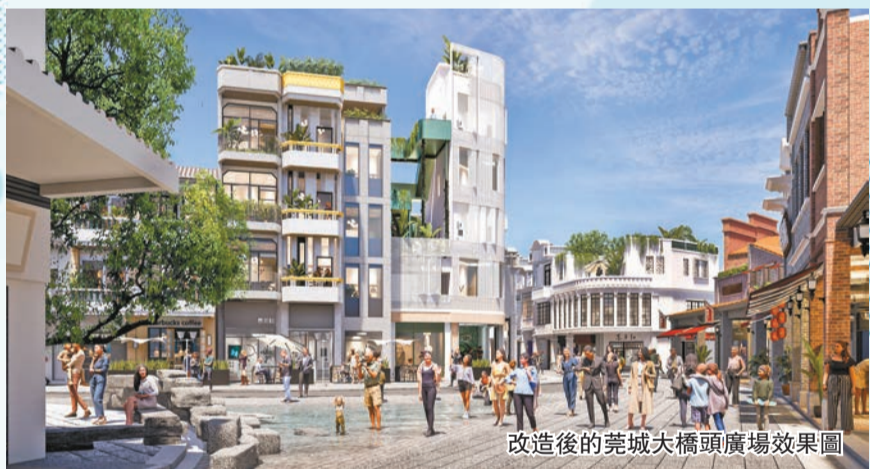
改造後的莞城大橋頭廣場效果圖

「東莞記憶」是對莞城街道的老舊建築、街道、河湧進行修舊更新，遵循「修舊如舊」的理念，拓展優化發展空間，吸引企業總部和高級商業回流，帶動優秀青年到莞城就業創業，加快推進莞城現代化建設。