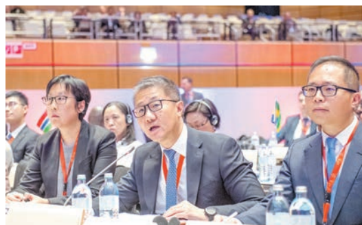
警務處處長蕭澤頤(中)出席奧地利維也納舉行的國際刑警組織全體大會。

【香港商報訊】記者萬家成報道：警務處處長蕭澤頤率領一行十人的香港代表團，跟隨公安部副部長徐大彤所帶領的國家代表團，出席11月28日至12月1日期間在奧地利維也納舉行的第911屆國際刑警組織全體大會。據了解，全體大會是國際刑警組織的最高權力機關，在每年一度的會議中，議決各項重要政策。今年有來自160個國家，超過1000名高級警務人員出席。