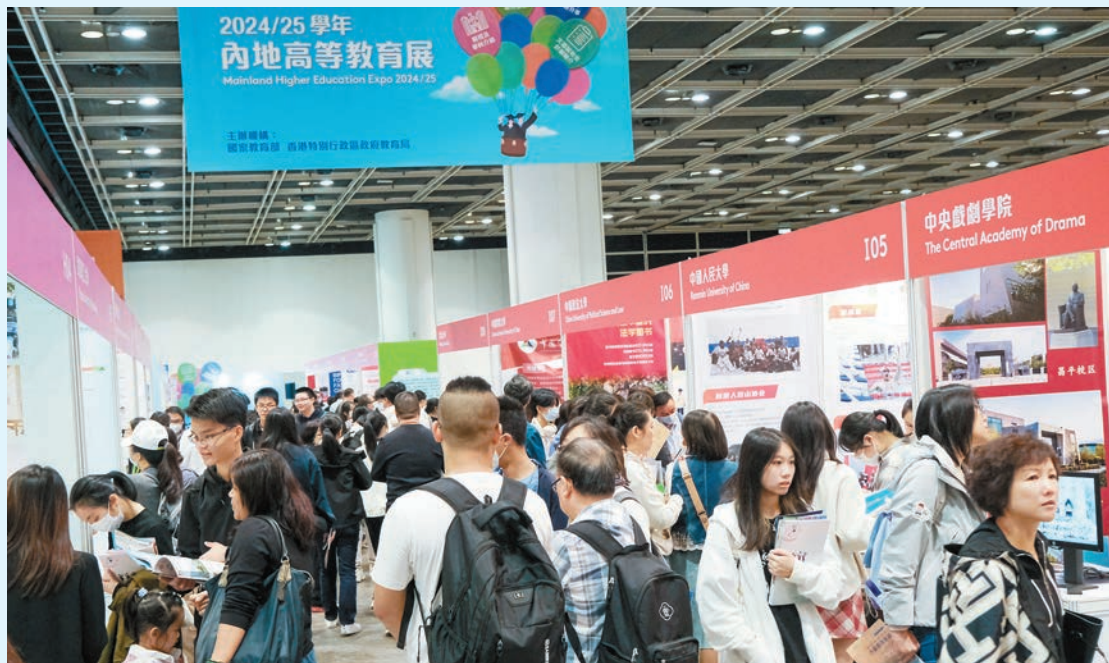
2024/25學年內地高等教育展昨起一連兩天在港舉行，吸引大批家長及學生進場。

【香港商報訊】記者周偉立報道：由國家教育部和香港教育局聯合舉辦的2024/25學年內地高等教育展昨日起一連兩天在本港舉行，為有意赴內地升學的學生和家長，介紹該學年內地高校招收香港中學文憑考試學生計劃（文憑試收生計劃）的各項安排及相關升學資訊。教育局局長蔡若蓮昨日在開幕禮致辭表示，文憑試收生計劃多年來取得良好成果，至今有超過42000名香港學生通過計劃報考內地高校。2024/25學年參與計劃的院校數目將增加至138所，為學生提供更多元、更適合自己的選擇。