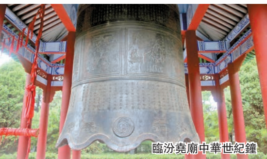
臨汾堯廟中華世紀鐘