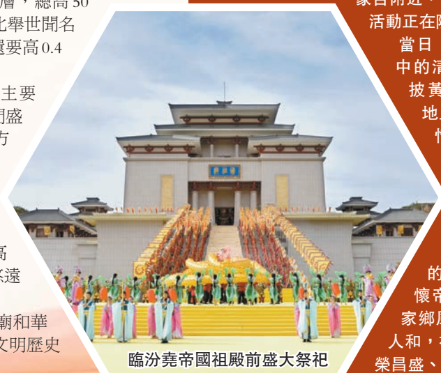
臨汾堯帝國祖殿前盛大祭祀

如今，位於臨汾堯都區的堯廟和華門，已成為全球華人了解華夏文明歷史及中華燦爛文化的重要場地。