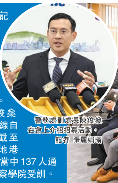
警務處副處長陳俊榮在會上介紹招募活動。

【香港商報訊】記者張麗娟報導：為便利內地就學的港生投考警隊，香港警務處昨日在北京舉行「香港警察·內地大學招募快線」活動。警務處副處長陳俊榮介紹，內地招募快線自去年展開以來，截至11月有715名內地港生申請投考警隊，當中137人通過測試，陸續到警察學院受訓。