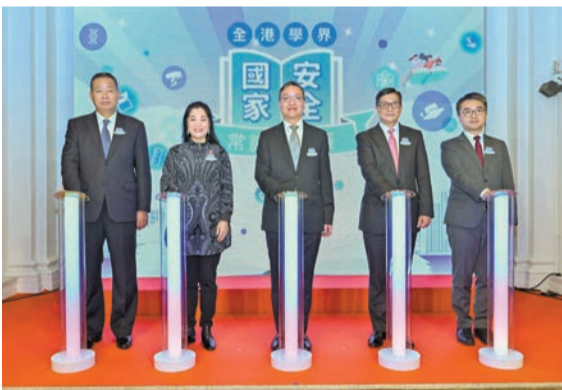
「全港學界國家安全常識挑戰賽」舉行啟動禮。

律政司司長林定國出席活動時表示，培養市民自覺維護國家安全是一項重大挑戰，不希望市民因為其他人的惡意抹黑或攻擊，而對國安法存有誤解，或者因為害怕受到法律制裁才遵守維護國家安全的