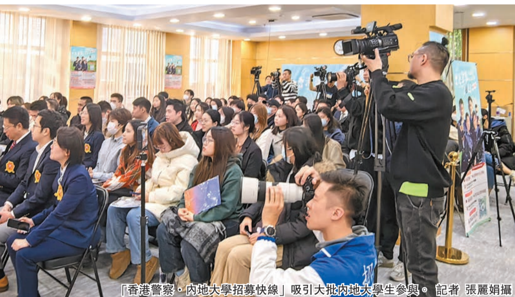
「香港警察·內地大學招募快線」吸引大批內地大學生參與。

陳俊榮表示，隨着內地與香港聯繫愈來愈緊密，有不少港人到內地定居、就業，香港學生到內地就學的人數也逐漸上升，故此招募組自2022年11月開始到訪內地的大學舉行「香港警察·內地大學招募快線」活動，遍及武漢、成都、廣州、福建等地。今次適逢公務員事務局在北京、上海舉辦綜合招聘考試、基本法及香港國安法測試，所以在這兩個城市舉行招募快線，希望方便在內地的港籍學生及人士加入警隊。除舉辦招募講座外，亦在校園即場進行警察遴選程序，現場亦有現職警察及招募組人員進行講解及分享。