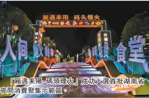
「廂遇耒陽·碼頭煙火」成功入選首批湖南省夜間消費聚集示範區。