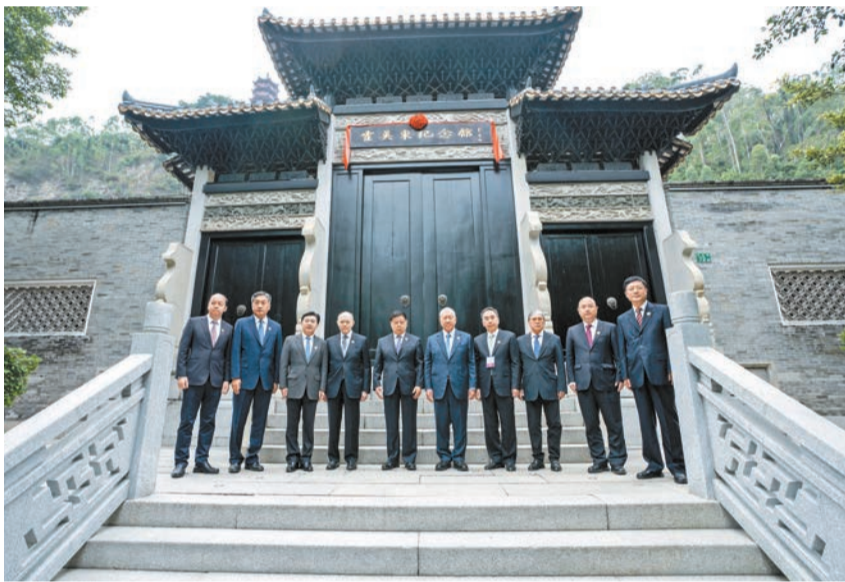
出席嘉賓合影。

霍英東是傑出的社會活動家、著名的愛國人士、香港知名實業家、中國共產黨的親密朋友，曾任第八、九、十屆全國政協副主席。