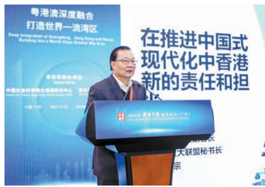
譚耀宗在研討會上發言。

【香港商報訊】記者黃裕勇報道：「讀懂中國」國際會議（廣州）上，以「粵港澳深度融合：打造世界一流灣區」為主題舉行平行研討會，來自香港、澳門及內地的各界嘉賓圍繞相關議題進行發言。這也是「讀懂中國」系列會議首次就粵港澳大灣區合作召開專題研討會。