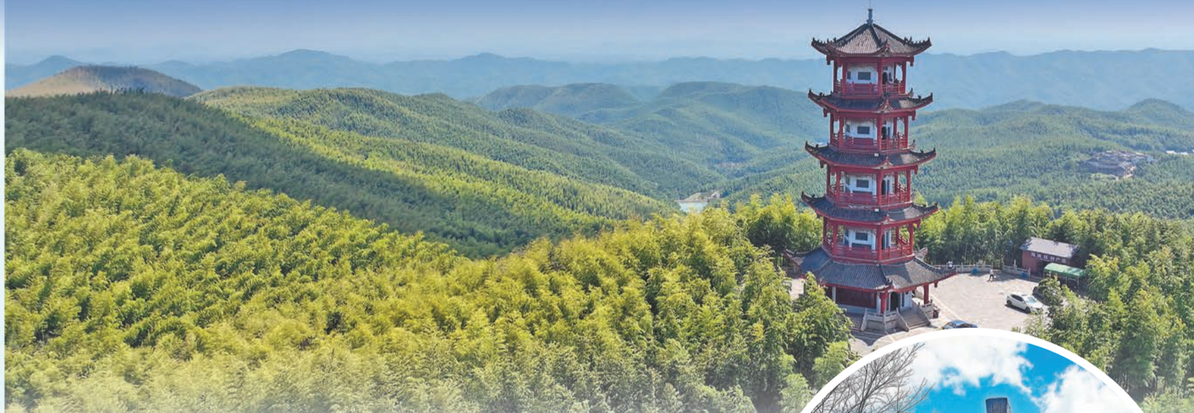
▲第二屆衡陽旅遊發展大會在耒陽盛大舉行。