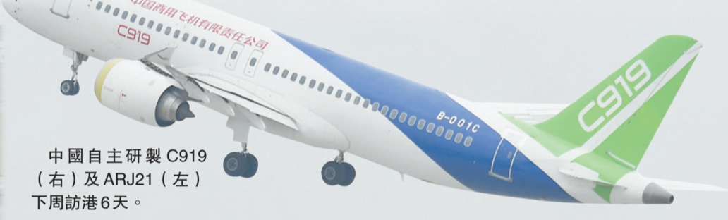
中國自主研製 C919 (右) 及 ARJ21 (左) 下周訪港 6 天。

【香港商報訊】記者馮仁樂報道：本港盛事真是一浪接一浪。昨日，行政長官李家超出席行政會議前會見媒體時宣布，繼國家載人航天工程代表團訪港後，由國家自主研製的C919飛機和ARJ21飛機將於本月12日至17日到訪香港展出。這是兩款國產飛機首次訪港，其中C919大飛機更是首次出訪中國內地以外城市。