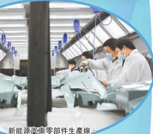
新能源汽車零部件生產線。

產業的發展，讓合川受到越來越多的企業青睞，實現項目資金流的匯集。今年1—10月，合川已簽約智能網聯新能源汽車零部件產業項目31個，協議引資210億元；重點在談項目70個，在談金額247.5億元。招商引資，成為推動合川智能網聯新能源汽車零部件產業高質量發展的動力引擎。 解讀招商引資的合川經驗，「精準」是關鍵詞。合川創新招商模式，細分北京、浙江福建、上海江蘇、機動、廣東、成渝六個招商小組，分區域、分階段開展零部件企業招引工作，聚焦「多渠道」精準發力。同時，合川圍繞長安、賽力斯等本地整車企業和二級配套企業，按照「從整車找總成，以總成找部件」的思路，對照新能源汽車產業鏈圖譜，全面梳理各鏈條上下游產品和企業發展情況，建立完善的智能網聯新能源汽車目標企業庫和項目數據庫。 招商過程中，合川積極謀劃高頻率外出招商，深化細化招商路徑，開啓高規格、高頻次、高標準招商行動，積極藉助專業峰會、招商中介、行業顧問等第三方力量，建立廣泛嚴密的招商網絡，形成招商優勢資源互補，全方位、全地域、全天候考察對接項目，並緊盯長三角、大灣區等地區的優秀項目資源。 在項目落地上，合川堅持落地項目專班服務機制，重點項目由區委書記、區長領頭推進，打造企業「招商建設」全生命周期服務品牌，從項目簽約起算審批時限原則不超過90天，驗收辦證不超過10天。圍繞要素保障、審批辦證、落地建設等環節提供全方位服務，合川對落戶企業實行「一企一專員」定期上門服務、排憂解難，全心傾聽、全力協調、全面推進項目落地建設，相關項目審批時限較以往的正常審批時限進一步壓縮60%，服務效率顯著提升。 今年7月，合川舉行了以「投資合川·共贏未來」為主題的2023年智能網聯新能源汽車零部件招商引資集中簽約活動。活動集中簽約重大招商項目23個，正式合同投資額210億元，涵蓋汽車零部件內外飾、車身輕量化、車路網聯、電驅、電制動以及汽車後市場服務等項目。簽約現場，企業代表紛紛表示，將積極整合相關優勢資源，加快推動項目實施，為合川區打造智能網聯新能源汽車零部件聚集高地，重慶汽車產業轉型發展「橋頭堡」作出貢獻。 下一步，合川區將圍繞智能網聯新能源汽車零部件產業園建設，加快推動零部件產業向電動化、網聯化、智能化方向發展。聚焦電驅動系統、電制動系統、輕量化材料、汽車內外飾、交換電設備等5個重點領域開展招商引資，打造集智能網聯新能源汽車零部件研發、生產、供應、汽車後市場服務等協同發展的完備產業鏈。 目前，合川已有智能網聯新能源汽車零部件企業101家，其中，規模以上企業68家，佔規模企業總數比重達25.3%。合川區正鑄定「5年6百億」奮鬥目標，用好重慶市首個智能網聯新能源汽車零部件產業園的金字招牌，助力重慶打造世界級智能網聯新能源汽車產業集群。一座崛起的產業新城，也正不斷展現其充滿底蘊、活力和前景的魅力！