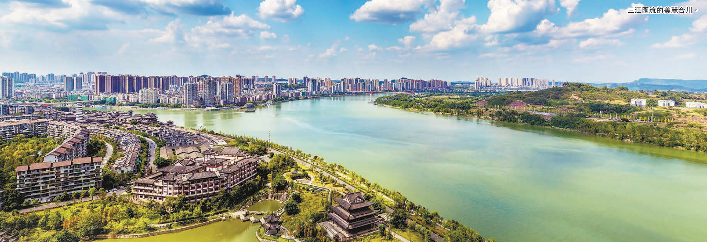
三江匯流的美麗合川。