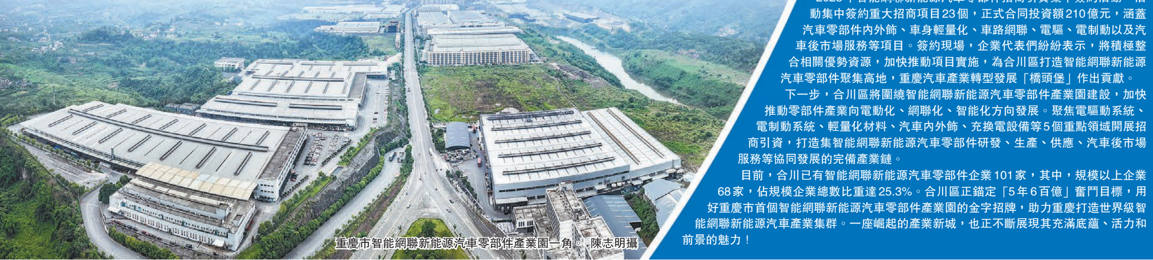
重慶市智能網聯新能源汽車零部件產業園一角。

型工業化（汽車）產業示範基地」「成渝雙城經濟圈產業合作示範園區」「重慶市汽摩特色產業示範基地」「重慶市承接產業轉移示範園區」「重慶市智能網聯新能源汽車零部件產業園」。2023年1—9月，產業園新簽約汽車零部件產業項目23個，協議引資210億元，儲備在談汽車零部件產業項目76個，總投資373.7億元。 如今，走入產業園，一批批智能網聯新能源汽車零部件生產企業如同「雨後春筍」一般，展現出蓬勃活力。在汽車內飾生產現場，在汽車電機配件生產現場……來來往往的工人們，勾勒出合川智能網聯新能源汽車零部件產業的新畫卷。