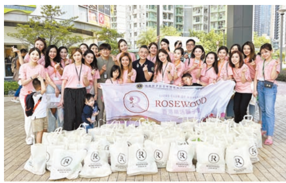
國際獅子總會中國港澳303區香港樂活獅子會於中秋舉辦上門探訪獨居長者服務。