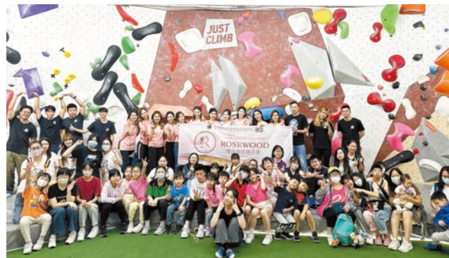
國際獅子總會中國港澳303區香港樂活獅子會於10月舉辦「攀石童樂日」支持一班基層小朋友挑戰自我，向目標進發。