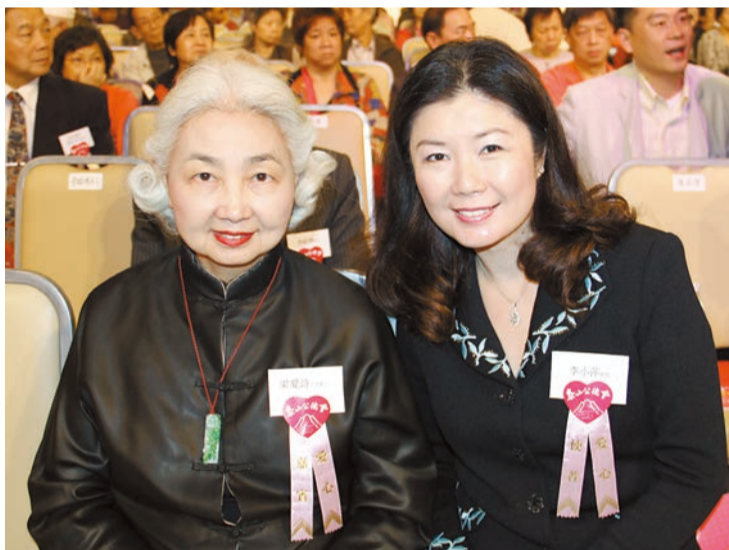
李小萍(右)與全國人民代表大會常務委員會香港特別行政區基本法委員會前副主任委員梁愛詩合照。