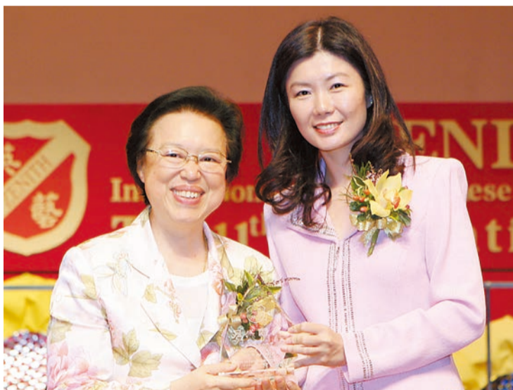
李小萍(右)與全國人民代表大會香港地區代表譚惠珠合照。