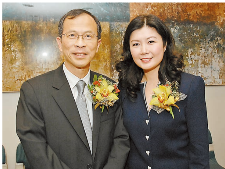
李小萍(右)與香港特別行政區立法會前主席曾鈺成合照。