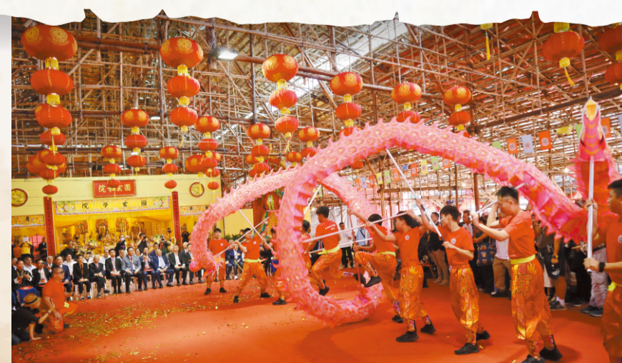
典禮完畢後，龍隊在醮棚舞龍慶賀。