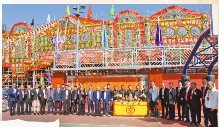
▼主禮嘉賓與大會首長及緣首等揭金榜後拍照留念。