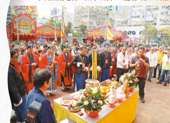
緣首跟隨圓玄學院經生道侶參與法事。