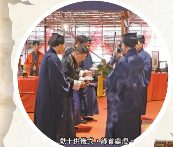
獻十供儀式，緣首獻燈。