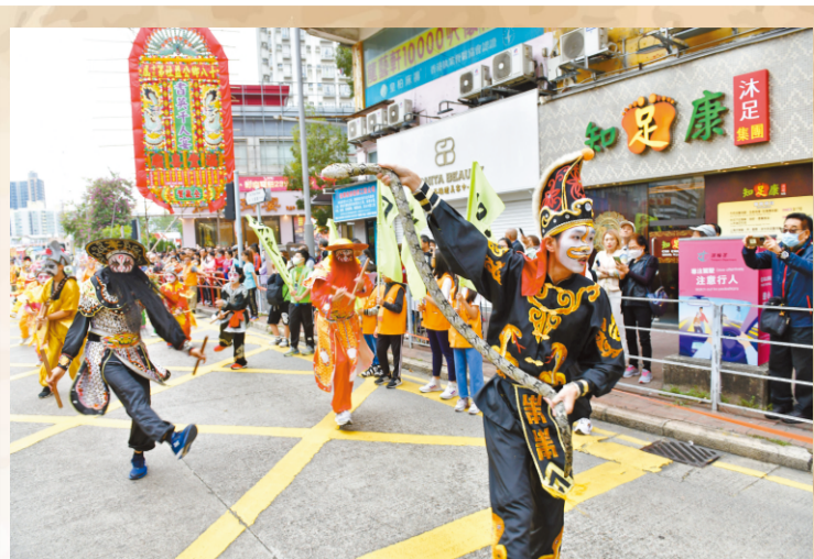
▲元朗潮僑英歌隊疫後首次參與巡遊。