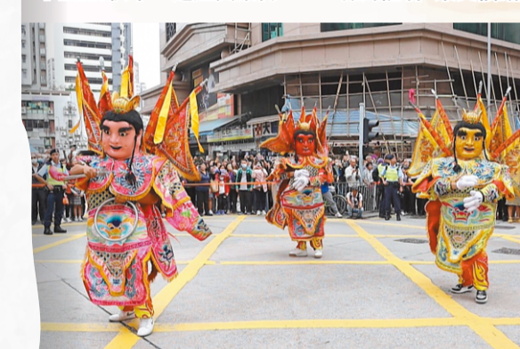
市民圍觀電音三太子跳舞。