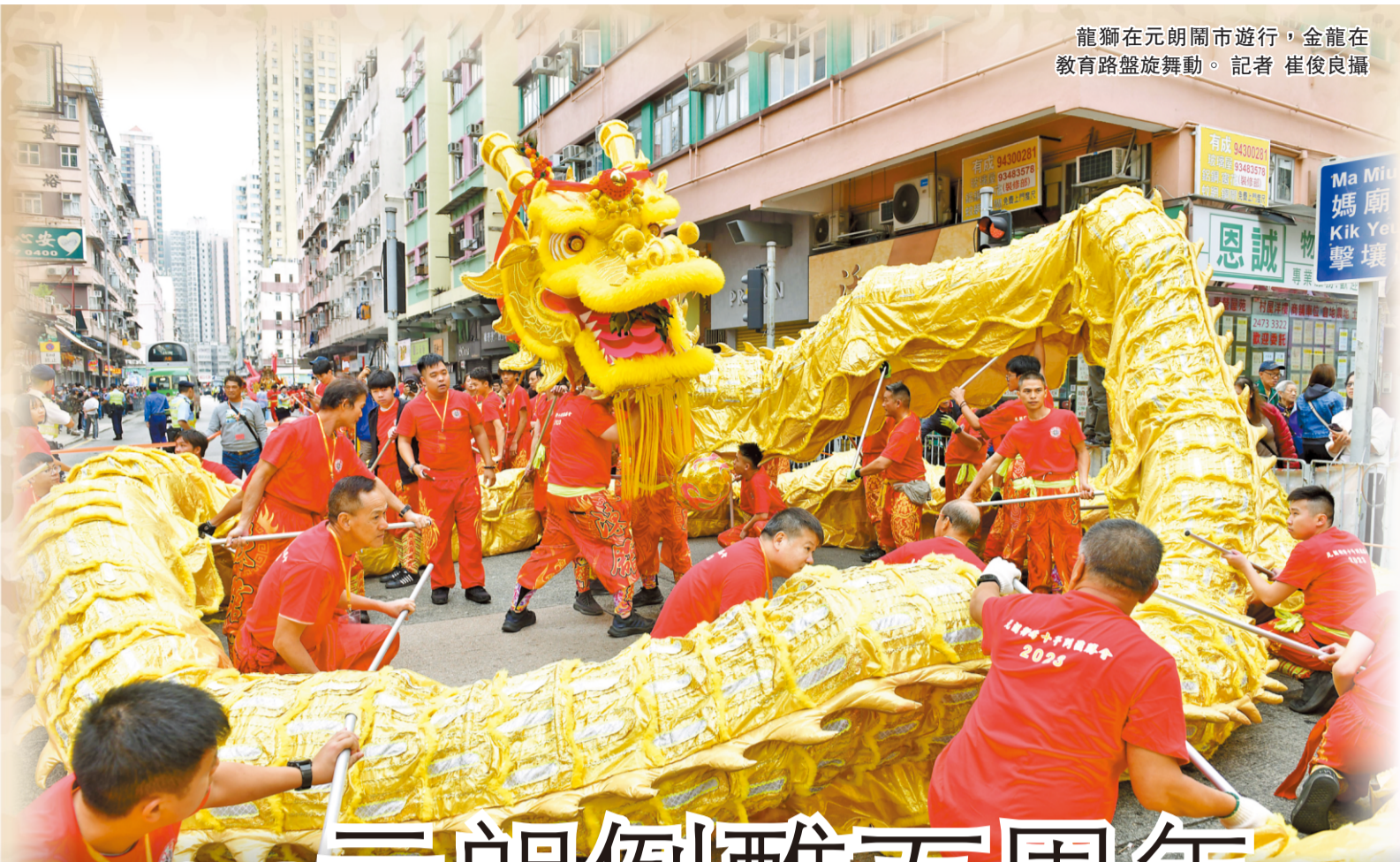
龍獅在元朗鬧市遊行，金龍在教育路盤旋舞動。記者 崔俊良攝