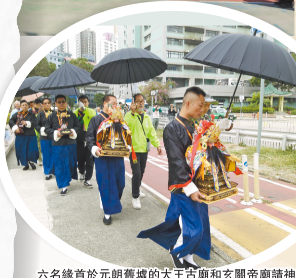
六名緣首於元朗舊墟的大王古廟和玄關帝廟請神回醮棚供奉，途經寶業街。

12月8日是宗教儀式最後一天，這天舉行莊嚴肅穆的貢諸天祭禮，圓玄學院法事科儀說，預備了109種果品及福物獻給天神，寓意功德圓滿，酬謝神恩。獻貢物中包括有齋、生果、京果、豆、蔬菜、糖果、餅食等，它們都整齊地放在三張長枱上。祭禮長達兩小時，四十多名經生道侶主持法事，到祭禮中段過後，緣首們分別獻十供，包括香、花、燈、水、果、茶、食、寶、珠、衣。貢諸天祭禮結束後，正式完醮。