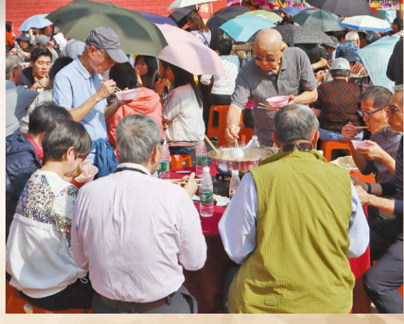
七日宗教儀式期間，大會提供近千圍素盆菜，街坊們在太陽底下享用。