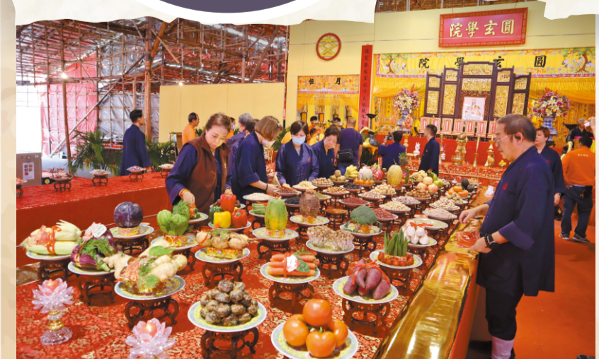
貢諸天祭禮貢品逾百種，儀式前要仔細鋪排。