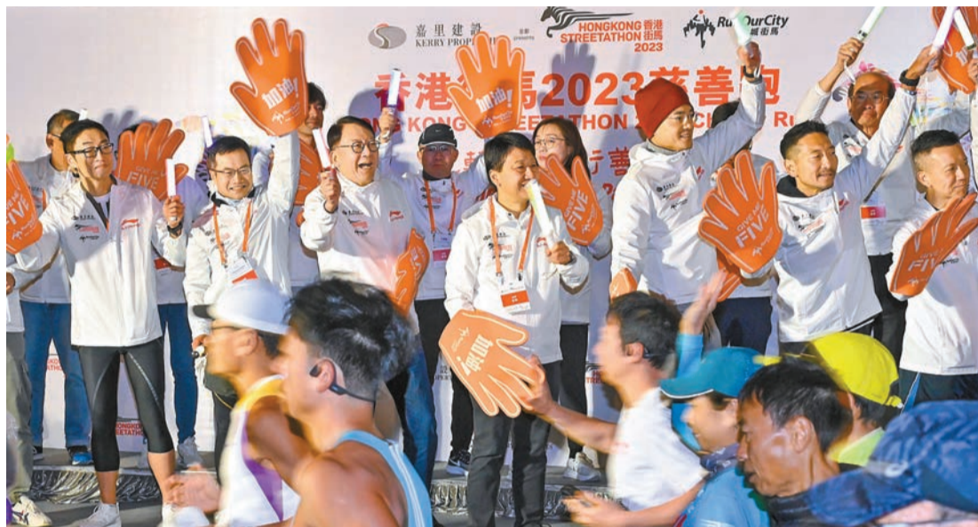
陳國基（前排左三）和眾嘉賓主持「香港街馬 2023」慈善跑開跑典禮。政府新聞處

【香港商報訊】記者戴合聲報導：疫後復辦的「香港街馬 2023」昨日在低溫下舉行，無損一眾跑手熱情，逾 1.5 萬名跑手參加，氣氛熱烈。賽事首次採用將軍澳——藍田隧道的 10 公里創新路線，參加者可沿途欣賞維港景色。政務司司長陳國基在開跑禮上表示，今次活動令各位跑手期待已久，更展現了香港的非凡活力。他強調政府會繼續聯同各界，加強推動體育普及化，推廣全民運動，將香港打造成為更具活力的宜居城市。