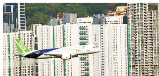
國產客機C919飛越維港，環繞香港島兩圈。

【香港商報訊】記者戴合聲報導：運輸及物流局表示，國家民用航空局（國家民航局）和中國商用飛機有限公司（中國商飛公司）的全力支持，國家自主研製的C919和ARJ21飛機一系列訪港活動得以順利舉行，讓香港市民見證國家航空製造業的重要里程碑。局方感謝國家民航局的大力支持，又認為一系列活動有助增加青年人對國家的認同。 運輸及物流局昨日表示，感謝國家民航局一直以來對局方及民航處工作的大力支持，期待可以一同奮力推動國家民航高質量發展，譜寫交通強國建設民航新篇章。 局方表示，特區政府繼續全力鞏固並提升香港在「十四五」規劃下「八大中心」的定位，包括國際航空樞紐的地位，以及積極與粵港澳大灣區內其他機場合作。