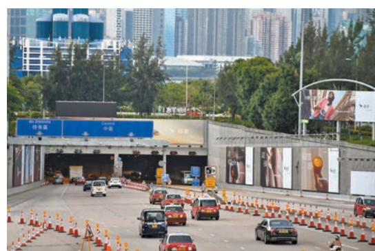
西區海底隧道昨日車流暢順。

【香港商報訊】記者戴合聲報導：三條過海隧道即西區海底隧道（西隧）、海底隧道（紅隧）和東區海底隧道（東隧）昨早5時起實施「分時段收費」。繁忙時段私家車使用紅隧及東隧，收費40元，比現時為高；非繁忙時段，三隧劃一減價至20元，運輸署估計繁忙時間過海私家車和電單車將減少10%。昨日是周日假期，三條過海隧道車流大致暢順。運輸署表示，三隧分時段收費運作至今正常，並指今日（18日）是實施分時段收費後首個工作日，署方會繼續密切監察交通情況。 運輸署在三隧來回方向位置，增設「隧道費顯示屏」，實時顯示隧道費，讓司機了解收費情況。在三隧「分時段收費」方案下，星期日及公眾假期，三條過海隧道會按時段收費，私家車收費介乎20至25元，電單車收費則介乎8至10元。