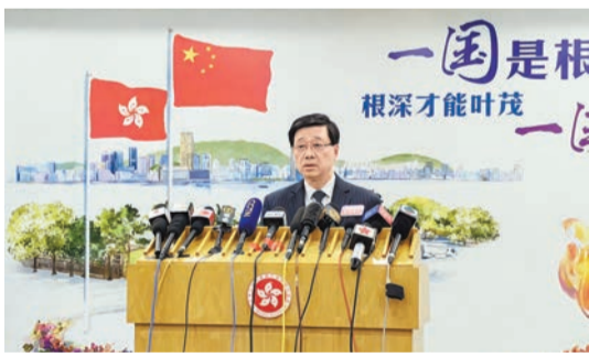
李家超在北京向國家主席習近平述職後會見傳媒。