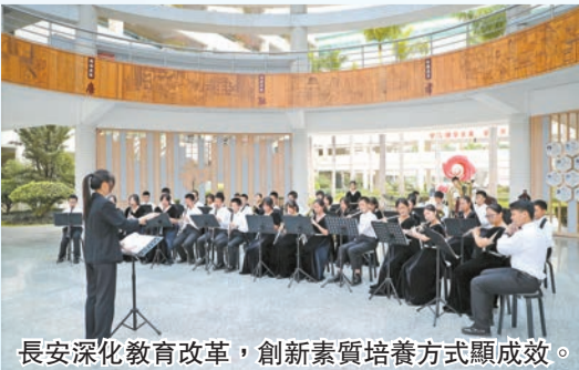
長安深化教育改革，創新素質培養方式顯成效。

A組個人全能第八名、第九名的好成績。 這些成績的背後，是長安在學生素質培養渠道方面不斷創新與積極實踐。目前，長安鎮成立長安蓮溪青少年交響樂團總團、長安書苑合唱團、長安書苑小蓮花藝術團，讓學生在家門口就能享受高雅藝術的熏陶。長安蓮溪青少年交響樂團總團現有5個分團，分設在5所小學，有團員400餘人；長安小蓮花藝術團連續12年6屆榮獲廣東省少兒舞蹈大賽金獎，創作獎，多項作品獲廣東省、市、市各大專業藝術賽事大獎，多次參加中央電視台1套「六一」晚會表演，多名學員考入中國人民解放軍藝術學院、北京舞蹈學院等全國專業藝術學院。近3年，全鎮師生在國家、省、市各類比賽中榮獲獎項4439人次。 此外，長安鎮還積極打造「思政+」思政課程體系，從愛黨、愛國、愛家鄉、愛校、愛生五個維度構建「思政+」大思政課程體系，2022年，組織「航天夢 強國夢 長安夢」六個一系列活動，引起20萬人次關注。打造「最潮」勞動教育，提出了「我勞動 我最潮」的勞動教育口號，搭建三大課程包括：品智生活，我領潮——生活勞動課程；產啟啓蒙，我弄潮——生產勞動課程；公益服務，我立潮——服務性勞動課程，在每年5月舉辦勞動教育特色月活動。打造「最炫」科技教育，通過「1248N」科學教育行動計劃，推動最「炫」團隊、最「炫」課程、最「炫」人才、最「炫」活動和最「炫」基地等五個方面建設工作。