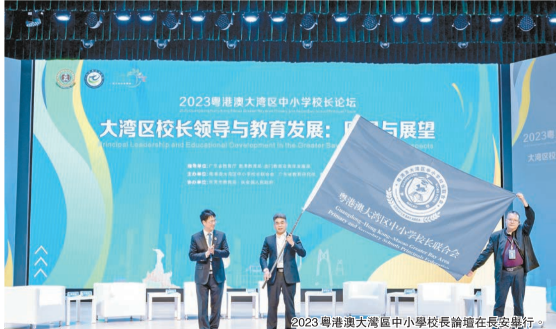
2023粵港澳大灣區中小學校長論壇在長安舉行。

日前，粵港澳大灣區中小學校長論壇在廣東省東莞市長安鎮舉行，來自大灣區的多位中小學校長齊聚長安及走訪長安中小學校園，並結合主題報告和主題沙龍的研討內容，提出走好教育教研之路的新探索、新思路，助推粵港澳大灣區教育事業高質量發展，為建設教育強國貢獻粵港澳大灣區力量。 長安，位於東莞市南端，毗鄰港深，南臨珠江口，既是大灣區內的經濟強鎮，也是東莞市首個、廣東省首批教育強鎮，第六批全國社區教育實驗區。近年來，長安鎮在GDP總量向千億大關邁進的同時，在民生教育方面先後實施擴大優質資源供給、重點領域改革、學生素質培養方式創新等舉措，教育綜合實力高位提升。