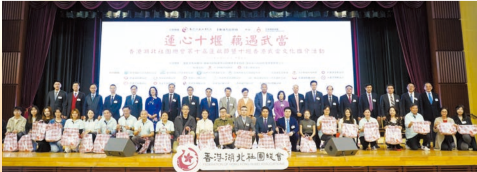
主禮嘉賓與該會首長向會員代表贈送蓮藕。