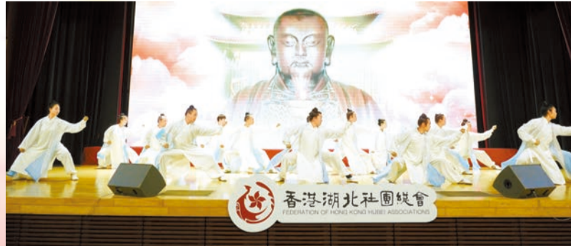
十堰武當功夫團專程赴港表演。