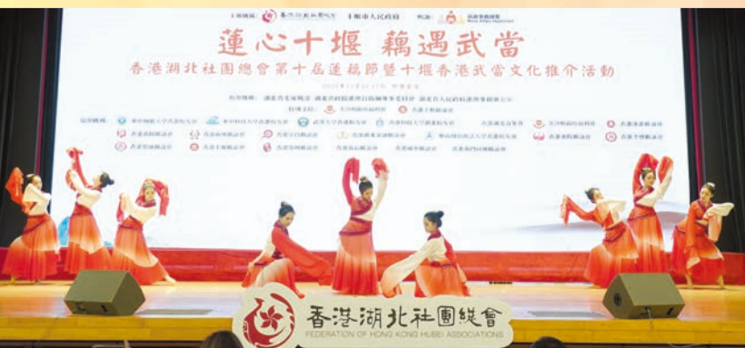
湖北青年會成員表演水袖舞《離騷》。