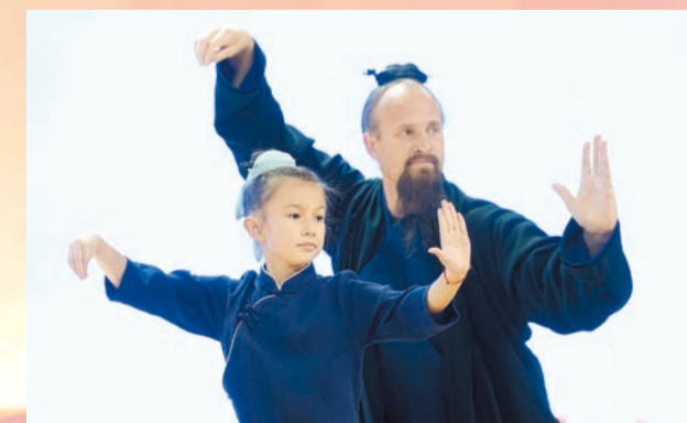
傑克一家表演武當太極玄武拳。