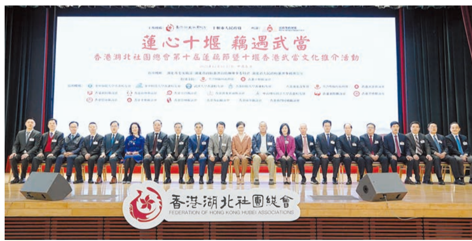
主禮嘉賓與該會首長在活動上合照。

家」，連續十年為鄉親送蓮藕，依託「同鄉市集嘉年華」開展湖北特產、荆楚風貌推介，組織開展武當太極文化系列交流活動，有力促進鄂港兩地的聯繫與合作，在香港唱響了湖北品牌，贏得了廣泛讚譽。陳亮希望總會當好「一國兩制」的守護者、「有呼必應」的服務者、「鄂港交流」的促進者，深度參與香港社會服務和社會治理，真正把總會建成服務香港基層民衆、關愛湖北鄉親的溫暖之家，為湖北建設全國構建新發展格局先行區貢獻智慧和力量。