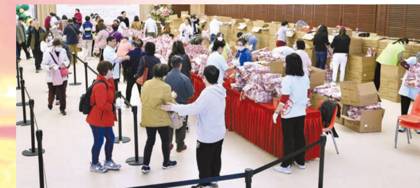
湖北社團總會向在港湖北鄉親和會員派送蓮藕。