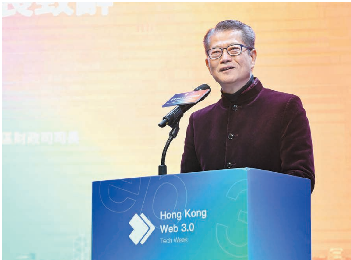
陳茂波昨日出席香港 Web3.0 安全科技峰會暨 Web3.0 年度頒獎典禮。

不過，他強調，本港絕不能單純因機遇龐大而忽略安全發展的重要性。再迅速的交易和再好的技術，如果運作過程中的風險缺口很大，根本談不上可持續的發展，更別說大規模的前進。這是為什麼在這個創新過程中，當局選擇進行適切的監管，港府非常看重安全的重要性，包括科技安全、資產安全、交易安全、運作安全、託管安全。他續稱，在技術不斷創新演變的過程中，單純用舊技術手段去監管新發展，是不管用的；透過明確邊界、建立護欄讓風險被有效管控，才能創造有利的環境在偶然性中孕育創新。