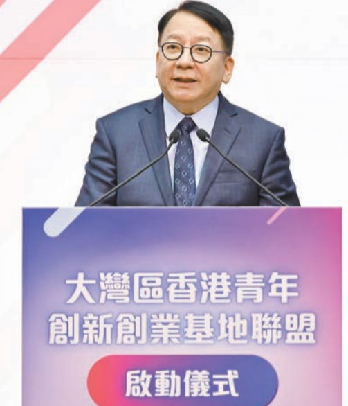
陳國基早前主持「大灣區香港青年創新創業基地聯盟」啟動儀式。

顏汶羽坦言，自己更注重計劃是否有意義，而「話頭醒尾有限公司」是最讓他有感覺的例子。他認為廣東話音樂受內地歡迎，期望能幫助團隊走進內地市場，開拓表演平台，讓團隊成為其他初階音樂人的發展範例。