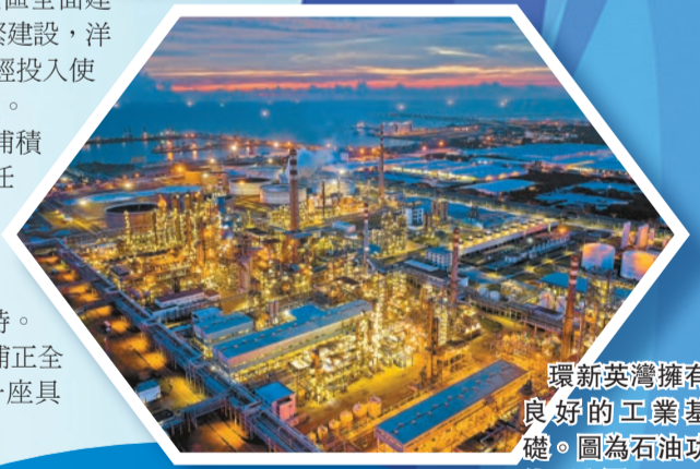
環新英灣擁有良好的工業基礎。圖為石油功能區夜景。