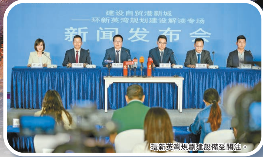
環新英灣規劃建設備受關注。

中國全面深化改革開放的「時」與「勢」把建設中國特色自貿港的歷史使命交給了海南。2022年以來，海南省委、省政府全力推進儋（州）洋（浦）一體化，加快建設海南自由貿易港「樣板間」，打造海南自貿港高質量發展「第三極」，受到海內外高度關注。