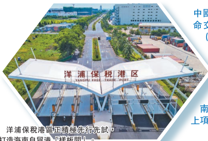
洋浦保稅港區正積極先行先試，打造海南自貿港「樣板間」。