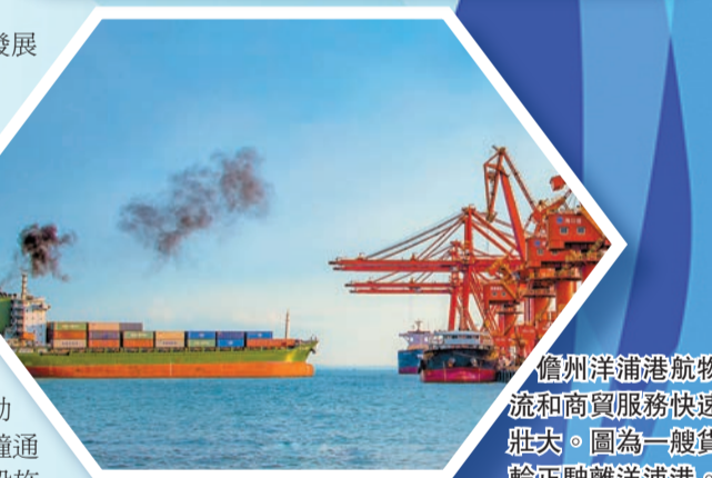
儋州洋浦港航物流和商貿服務快速壯大。圖為一號貨輪正駛離洋浦港。

春來潮湧東風勁，揚帆起航正當時。在海南自貿港紅利加持下，儋州洋浦正全力推動將環新英灣地區打造成為一座具有國際競爭力和影響力、代表海南自貿港建設成果和展示中國風範的現代化產業新城。