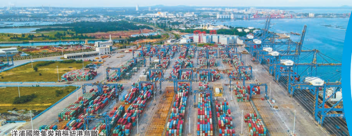
洋浦國際集裝箱樞紐港鳥瞰。

不只是潤澤自貿港國際數據產業園項目，深儋科創中心、華能核電服務保障基地、新英灣黃岡高級實驗中學、環灣新區鄰里中心等4個建設項目從簽約到開工，用時僅一個多月。 儋洋一體化以來，儋州洋浦對標國際重要港口城市，將環灣區作為核心發展區，通過國土空間一體化規劃、產業發展一體化布局、公共服務一體化配置、基礎設施一體化建設，努力打造成為海南自貿港最有活力、最具發展潛力的地區，依託不斷優化的營商環境，正獲得越來越多的投資者青睞。