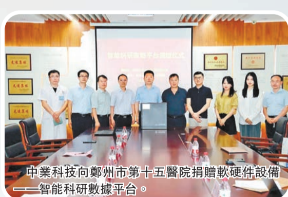
中業科技向鄭州市第十五醫院捐贈軟硬件設備——智能科研數據平台。

從2011年起中業科技的NLP自然語言全球翻譯社交數據庫的探索，到2023年中國版chatGPT智慧醫療和教育板塊的打造。從2023年1月份中業科技受邀參與全國信標委人工智能分委會知識圖譜工作組主辦的《知識圖譜互聯互通白皮書》編制工作，到中業科技作為核心單位參與由國家人工智能標準化總體組、全國信標委人工智能分委會指導編寫的《人工智能倫理治理標準化白皮書（2023版）》國家標準的制定，再到中業科技作為河南省唯一參與的本土企業。2023年4月14日由中國衛生信息與健康醫療大數據學會和《中國衛生信息管理雜誌》聯合舉辦的2023（17th）中國衛生信息技術/健康醫療大數據應用交流大會暨軟硬件與健康醫療產品展覽會（2023 CHITEC），中業科技作為一家專注於