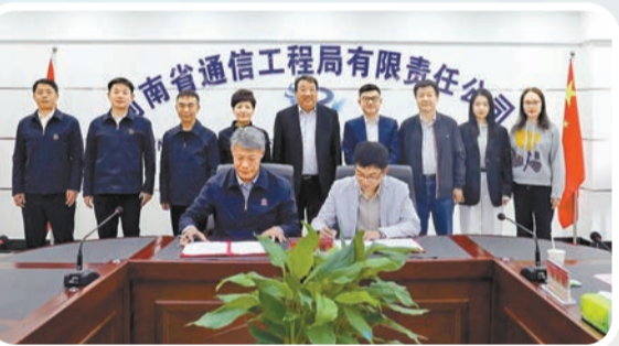
中業科技與河南省通信工程局有限公司簽署《智能醫院生態建設戰略合作協議》。