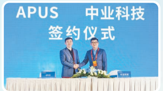
在2023河南省互聯網大會人工智能分會現場，中業科技與APUS公司簽署合作協議。

代信息技術、數據處理、人工智能相關技術與具體場景相結合。通過對語義理解、機器翻譯、人機交互三大核心技術領域的不斷深耕與錘煉，並與中業雲數據和人工智能算法的深度融合，賦予機器感知、交互和理解的能力，形成了AI+社交、AI+翻譯、AI+醫療、AI+機器人、AI+硬件等「AI+」（AI賦能）模塊，語音識別、智能翻譯、智慧交通、智慧醫療、智能製造等特色業務多元化的生態體系，讓人工智能更好地為實際生活服務，實現了從「解決人與人溝通」到「解決人與AI溝通」的創新轉變。