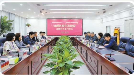
中業科技與河南省通信工程局有限公司簽約儀式現場。