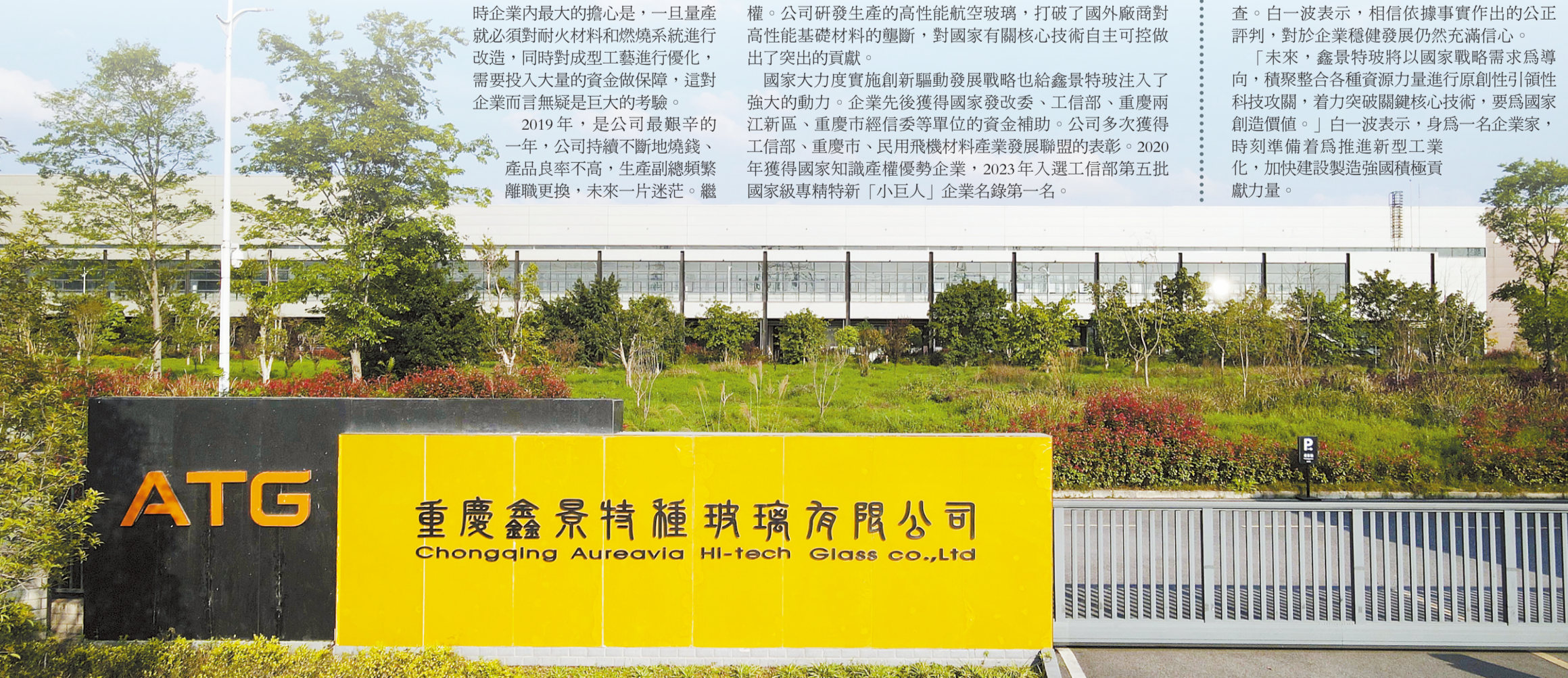
▼鑫景特玻現代化廠房。