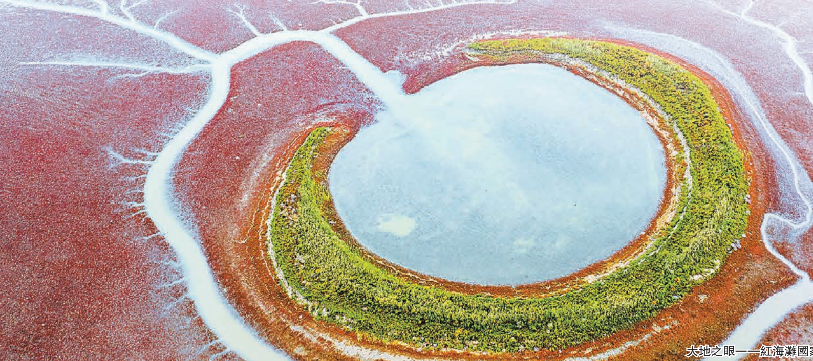
大地之眼——紅海灘國家風景廊道。