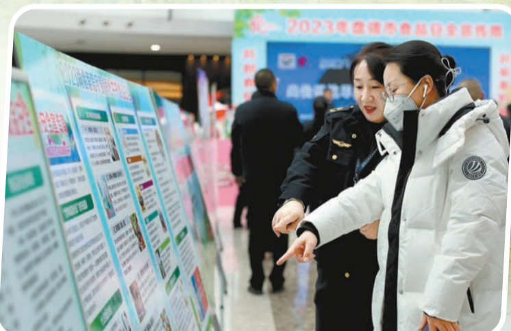
工作人員在辦事大廳熱情接待前來辦事的群眾。