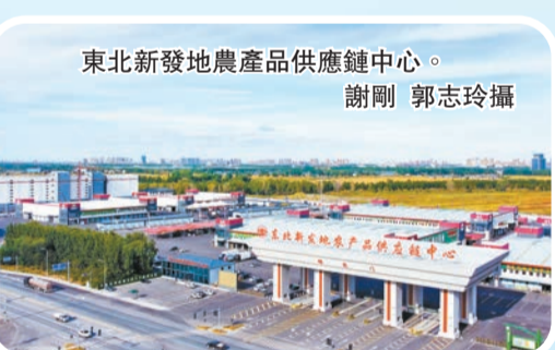
東北新發地農產品供應鏈中心。

今年以來，盤錦大米品牌提升工程取得重要進展。「盤錦大米」入選全國商標品牌建設優秀案例，「紅海灘1號」榮獲第十九屆中國國際糧