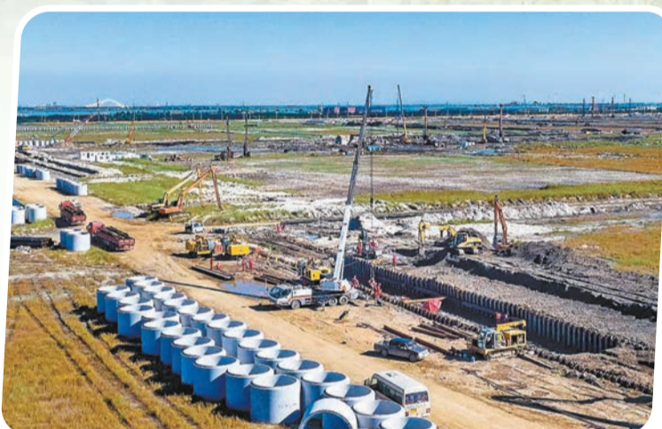
華錦阿美精細化工及原材料工程項目建設現場。