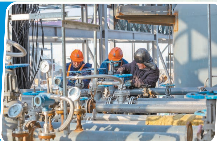
三力中科年產10萬噸新材料生產項目。