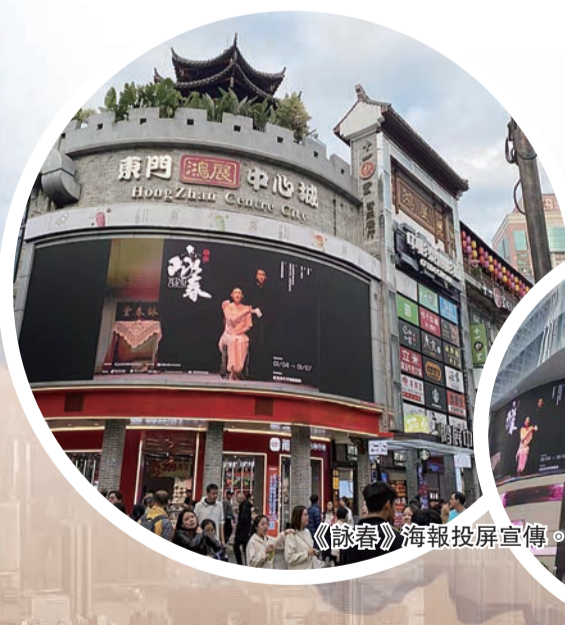
《詠春》海報投屏宣傳。

從文化影響的角度來看，舞劇《詠春》不僅是一部優秀的作品，更是一部具有深刻文化內涵的藝術瑰寶。評論人士認爲，這部出自深圳的文藝精品，根植於嶺南文化，連接着內地與香港同宗同源的同胞情深，而其題材所選擇的切口，也在對中國武術中所承載的大國自信、民族智慧的傳達中，擁有着恰到好處的美學表達和傳播意義。