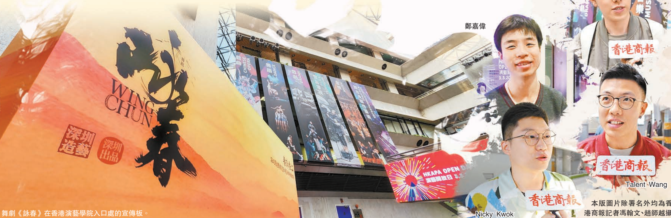
舞劇《詠春》在香港演藝學院入口處的宣傳板。