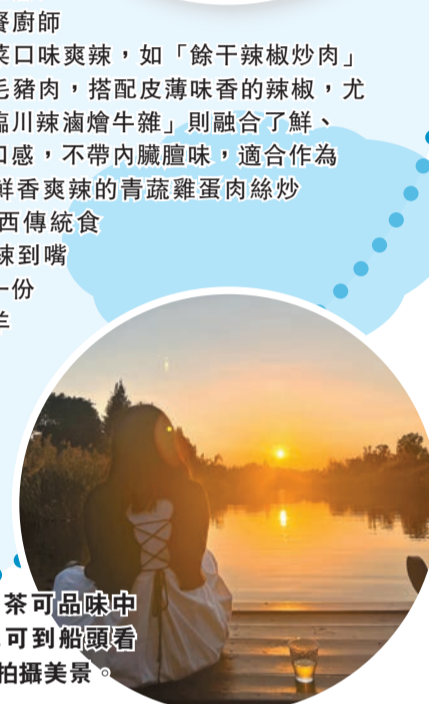
遊船下午茶可品味中式美點，也可到船頭看夕陽餘暉，拍攝美景。