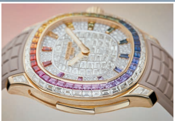
Aquanaut Luce 「彩虹」腕表表環由兩行長方形寶石潤飾，鑲以多色藍寶石，呈現出彩虹色彩。

Aquanaut Luce 系列另一款式 5260/1455R-001，表面和表環外行鑲有130顆長方形鑽石，而表環內行、表側、三間打簧滑動桿和玫瑰金表鏈則鑲有779顆長方形多色藍寶石。表面中央、表環、表側及表鏈外側和中央鏈節上採用了「隱密