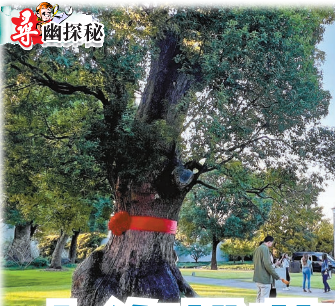
香樟樹王粗壯茂密，住客可澆灌老樹，體會歷史循環不息。

上海，是不少港人內地旅遊必去之地。是次筆者前往的並非上海熱門景點，而是這座繁華都市的桃花源，下榻度假酒店「養雲安縵」。住在明清古宅，看千年樟樹，體驗「佛系」生活，嘗特色江西美饌，感受隔絕喧囂的寧靜。