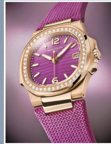
頂級 Wessafion 純淨鑽石。7010R-013 八角形表環鑲有 46 顆