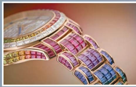
5260/1455R-001 玫瑰金表鏈鑲有藍寶石。

Nautilus 系列尚推出兩款優雅運動風格時計 7010R-013 與 7010/1R-013，加添了紫調裝飾，表環鑲嵌寶石點綴，均採用玫瑰金表殼。表面保留了該系列的經典小型波浪圖案裝飾。表面上有50道亮漆薄層，先是半透明紫色，後是無色漆層，營造出含蓄如幻的深邃效果。尖拱形小時刻度、立體阿拉伯數字和刀形時針、分針均採用玫瑰金製造，並添加白色夜光塗層，在紫色背景下顯得格外鮮明，確保讀時清晰。