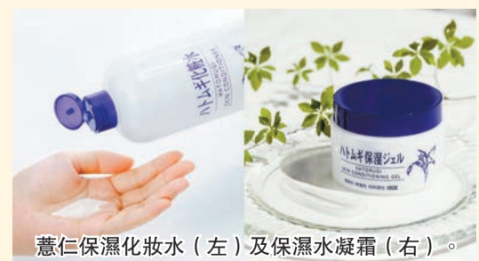
薏仁保濕化妝水 (左) 及保濕水凝霜 (右)。

冬日天氣乾冷，皮膚容易出現乾燥、敏感等情況，這時為肌膚保濕相當重要。日本薏仁保濕系列護膚產品，不論是化妝水或保濕水凝霜均性價比高，品牌並推出更新配方的薏仁化妝水，產品更水潤、溫和，提升肌膚保濕力。