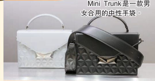
Mini Trunk 是一款男女合用的中性手袋。