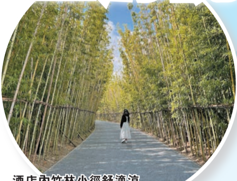
酒店內竹林小徑舒適涼爽，漫步其中很是寫意。