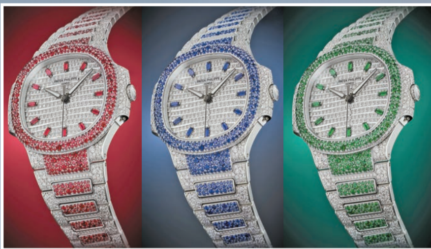
Nautilus 系列備有 (左起) 紅寶石、藍寶石及綠寶石三個款式，奢華名貴。

女裝時計以優雅造型與精準工藝，凸顯高雅氣息。瑞士百達翡麗呈獻 Aquanaut Luce 和 Nautilus 兩個系列新款三間腕表以及珠寶腕表款式，並首度採合 Aquanaut 時計系列「現代悠閒時尚」風格，推出新款三間腕表，作為時尚配飾，盡展女性的高貴魅力。 記者：Katherine