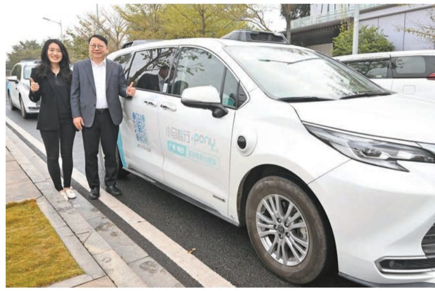
政務司司長陳國基(右)在小馬智行副總裁莫瑛怡(左)陪同下，在廣州南沙試乘該公司的自動駕駛出租車。

【香港商報訊】記者戴合聲報道：政務司司長陳國基昨日在廣州和惠州繼續粵港澳大灣區內地城市訪問行程。他表示，期待港穗兩地繼續貫徹「優勢互補、互利共贏」的原則，在經貿、文化等領域拓展交流合作並推動更多政策創新和突破，為大灣區高質量建設作出新貢獻。