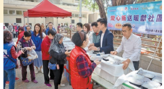
葵盛東邨關愛隊昨日聯同立法會議員及區議員向長者送贈愛心飯盒。記者 馮瀚文攝

在十樓的獨居婆婆家中，關愛隊拿出福袋中的羅漢果、茶葉和年糕禮品給婆婆看，婆婆說禮物又靚又有心。九樓住戶同樣是一位婆婆，看到關愛隊