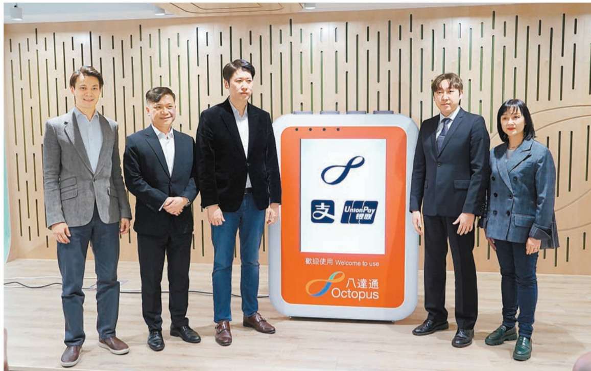
八達通、銀聯、AlipayHK等代表出席昨日八達通新聞發布會。

乘客乘搭的士後，可使用實體八達通或手機八達通拍收費系統，聽到「嘟」一聲即成功收費，使用銀