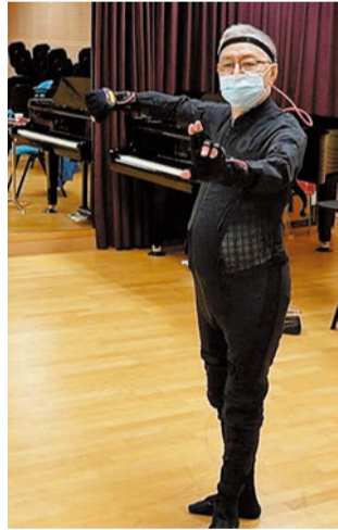
粵劇名伶阮兆輝穿上設有19個感應器的動作擷取設備親自示範，粵劇生行身段電腦評估系統精確地把每個關節動作記錄下來。

該程式透過「音控方格」(Expression Grid)技術，用家只需觸碰平板電腦屏幕便可彈奏樂曲。程式內置10首曲譜，包括