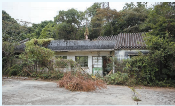
田夫村公立學校設校四十年，村民已申請將之改成村公所。