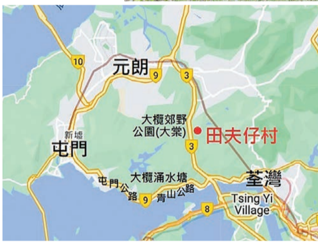
田夫仔村位置示意圖