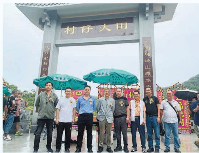
去年7月2日牌坊開光，田夫仔村及其分支村落與其他村落的代表合照留念。

水，去年政府便運送十幾箱水（每箱一噸水），花費十多萬元（每箱約萬元）解決水源不足問題，他說已申請自來水供應十多年，希望政府回應村民訴求。