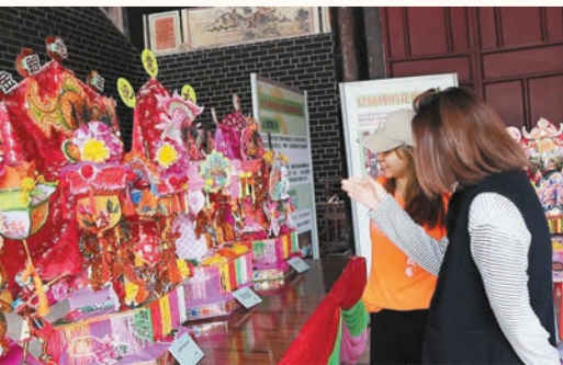
學員鑑賞作品及互相交流。