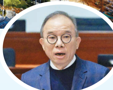
曾國衛在會上羅列一系列與灣區相關的惠民措施。

張曼莉則稱，創新科技是激活經濟高質量發展的重要引擎，特區政府聯合廣東省在粵港科技創新合作專責小組，共同推進大灣區科技創新平台建設、強化粵港科研協同；而就河套發展、港深科技創新合作等亦分別設有專班，聚焦促進河套、港深產學研協同和創科聯動。除了河套，特區政府亦着力推動其他粵港澳重大合作平台的發展，例如前海，當局已經邀請數碼港研究於流浮山建設新的創科設施，對標聯動一灣之隔的前海，把握前海發展的機遇及推動現代服務業科技發展。