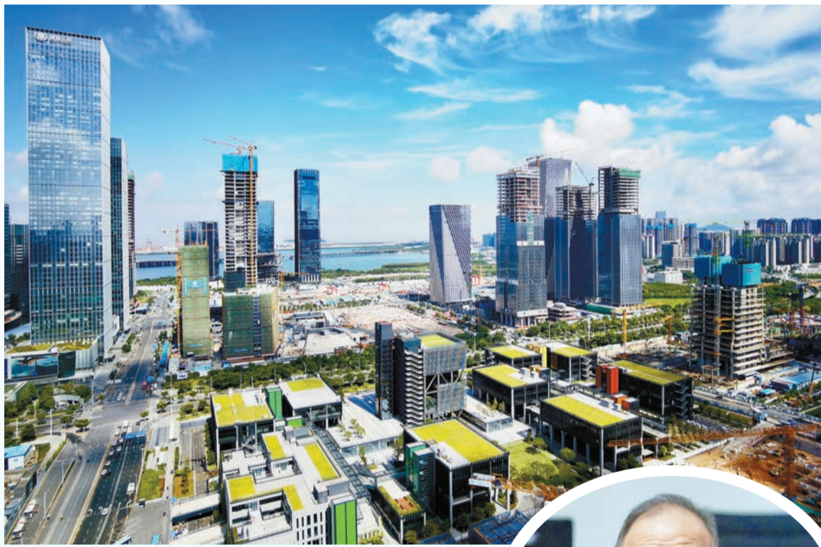
當局指，香港會繼續積極發揮大灣區中心城市和核心引擎的重要功能。圖為建設中的深圳前海。 中通社

【香港商報訊】記者戴合聲報道：立法會連日討論「加強粵港澳大灣區共同發展」議案。昨日，政制及內地事務局局長曾國衛、商務及經濟發展局副局長陳百里、創新科技及工業局副局長張曼莉等官員於會上作總結發言。曾國衛感謝有關議員議案，並羅列一系列與灣區相關惠民措施，包括「港車北上」、「經珠港飛」、優化「跨境理財通」、擴大「港澳藥械通」等。他說，展望未來，特區政府會帶領社會各界抓緊國家和大灣區發展帶來的重大機遇，全力發揮香港作為內地和全球市場之間「超級聯繫人」和「超級增值人」雙重角色，並以香港所長服務國家所需。