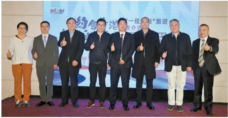
兩地領導與嘉賓在會上合照。

隨後，海南省旅遊協會與香港中國旅遊協會、海口市旅行社協會與香港外遊旅行團代理商協會分別簽署了兩份戰略合作協定，旨在建立海南與香港長效合作機制，推進「一程多站」旅遊合作模式，實現雙方遊客互送，助力兩地旅遊合作和發展。