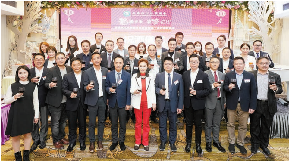
香港四川社團總會首長與主禮嘉賓大合照。

重點同鄉社團在香港愛國愛港事務中的先鋒力量，繼續開展更多有特色、具實效、接地氣的工作，促進川港交流、協同川港發展，希望大家繼續發揚無私奉獻的精神，為香港、為祖國作出更多貢獻！」會上，主禮嘉賓向優秀義工集體、優秀義工個人頒發證書及感謝狀。當晚有抽獎助興，獎品豐富，氣氛熱烈。